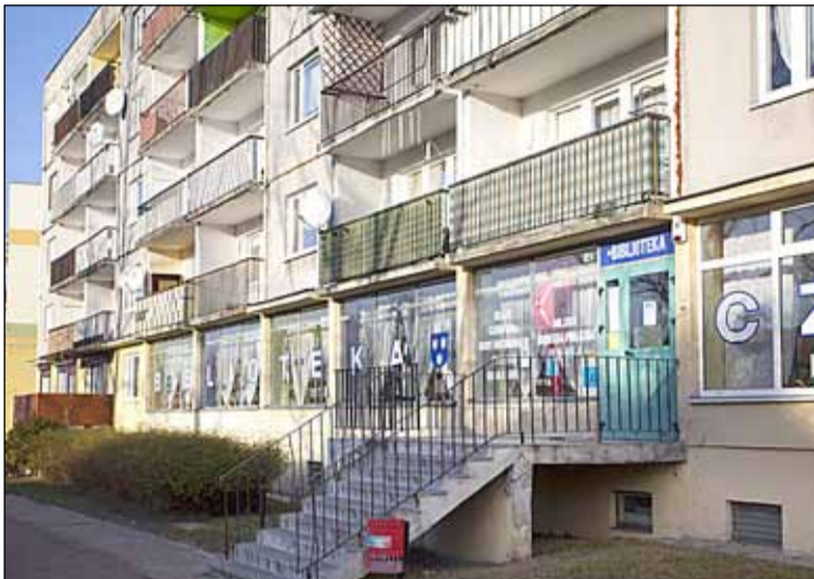
ul. 20 Stycznia 14