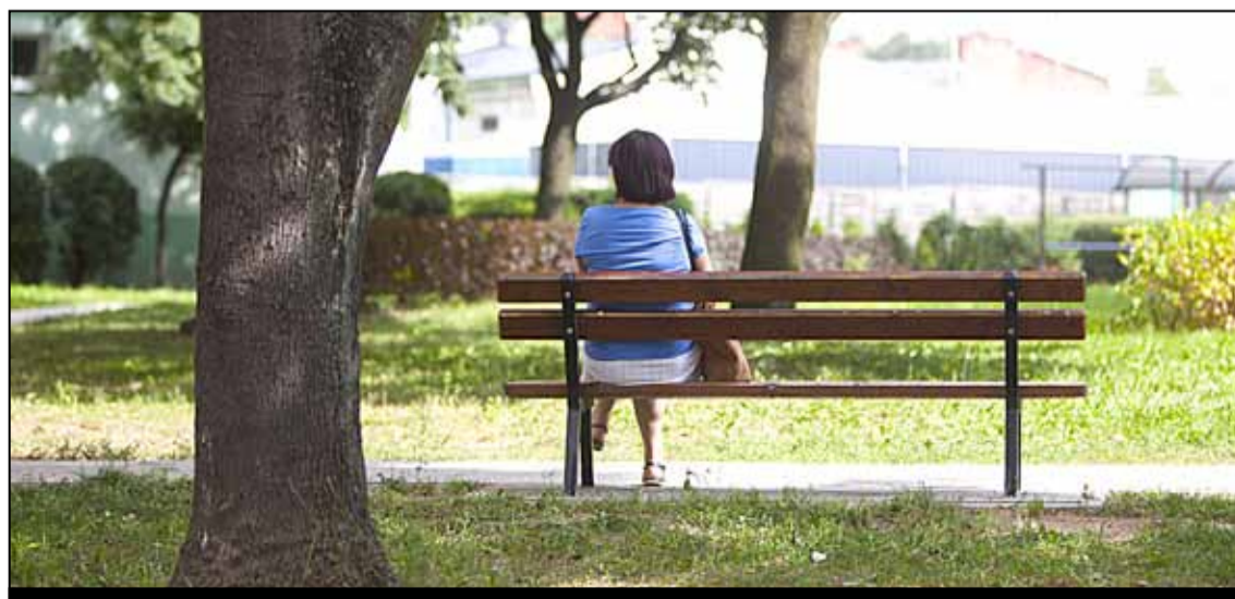
ul. Cicha 35 – 4 nowe ławki

► św. Jana 29 ► św. Jana 31 ► św. Rocha 5 ► św. Rocha 5a ► Zamkowa 18