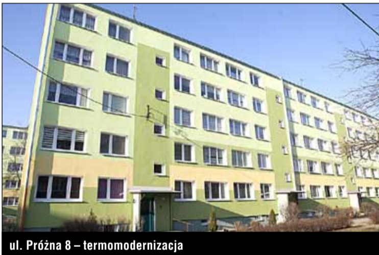
ul. Prózna 8 – termomodernizacja