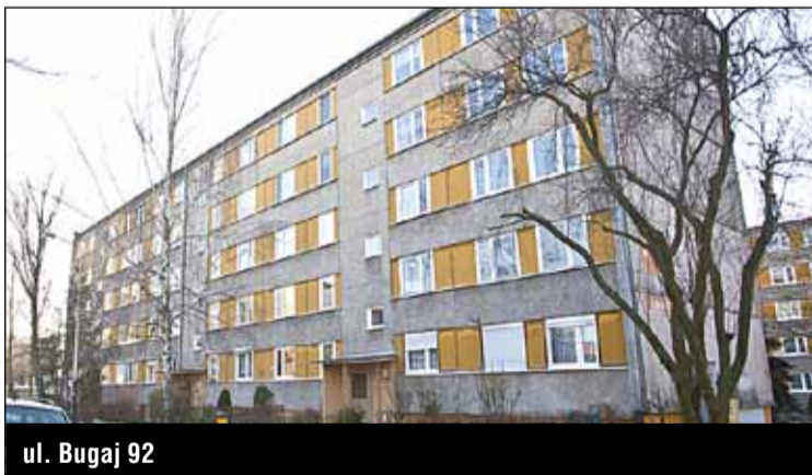
ul. Bugaj 92