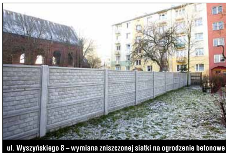
ul. Wyszyńskiego 8 – wymiana zniszczonej siatki na ogrodzenie betonowe

Wymieniono 7 sztuk drzwi wejściowych do klatek schodowych w 2 budynkach przy ulicach: