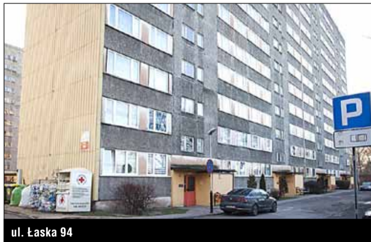
ul. Łaska 94