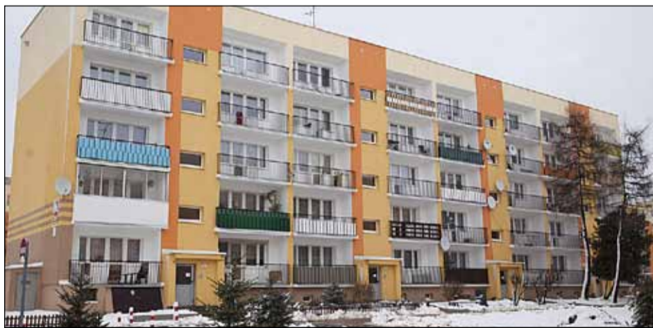
ul. Grota-Roweckiego 27 – termomodernizacja