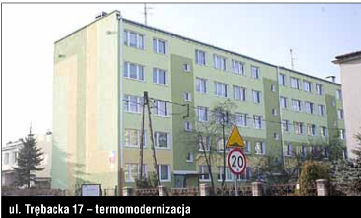
ul. Trębacka 17 – termomodernizacja