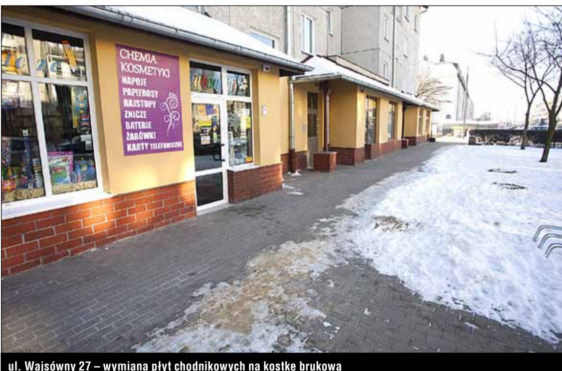
ul. Wajsówny 27 – wymiana płyt chodnikowych na kostkę brukową