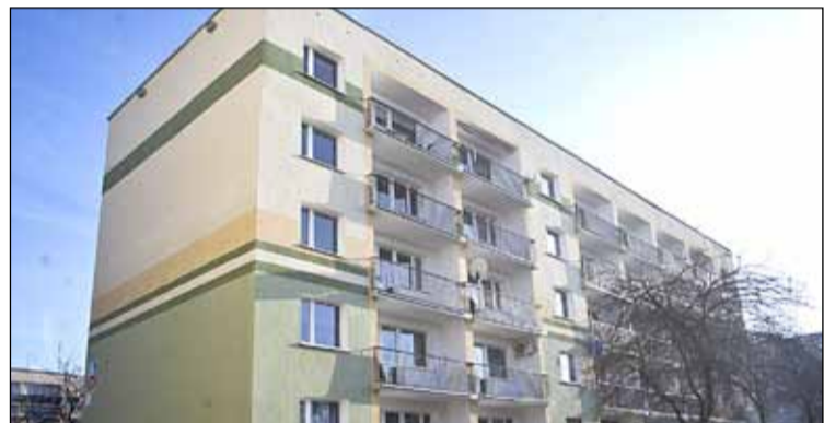
ul. Narcyza Gryzla 10 – termomodernizacja