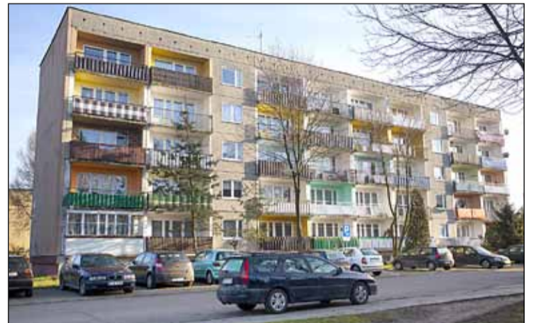
ul. Mokra 17