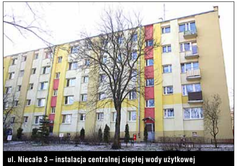
ul. Niecała 3 – instalacja centralnej ciepłej wody użytkowej