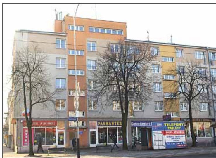
ul. Zamkowa 18 – instalacja centralnej ciepłej wody użytkowej

► Wymieniono nawierzchnię placu zabaw wraz z ponownym montażem urządzeń zabawowych i ogrodzenia przy budynku przy ulicy Konopnickiej 49.