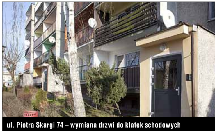
ul. Piotra Skargi 74 – wymiana drzwi do klatek schodowych