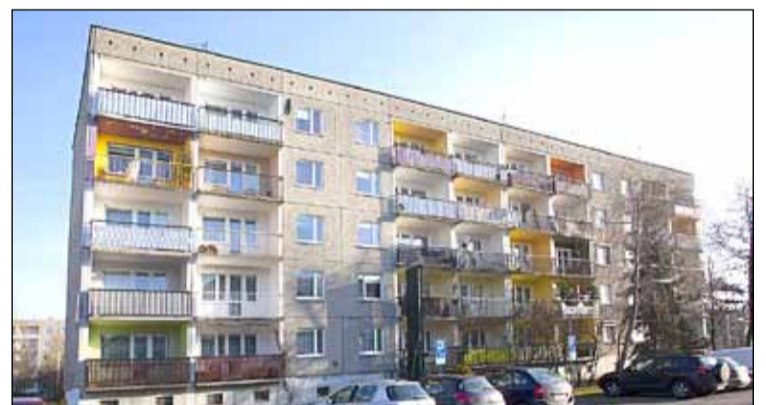
ul. Mokra 19