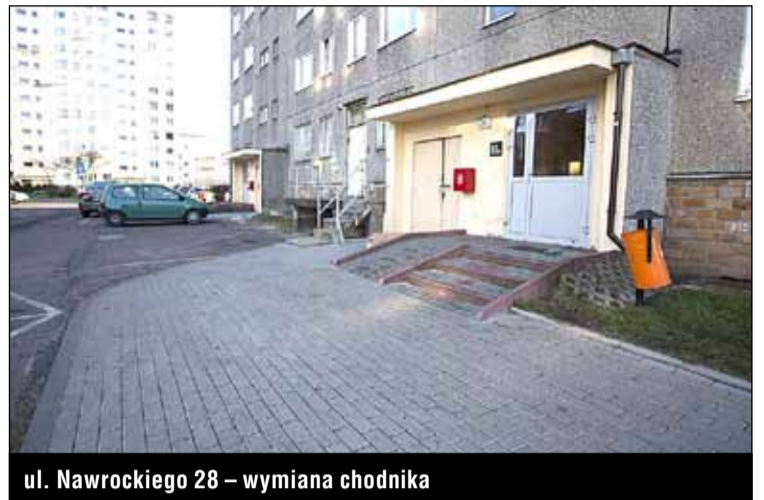
ul. Nawrockiego 28 – wymiana chodnika