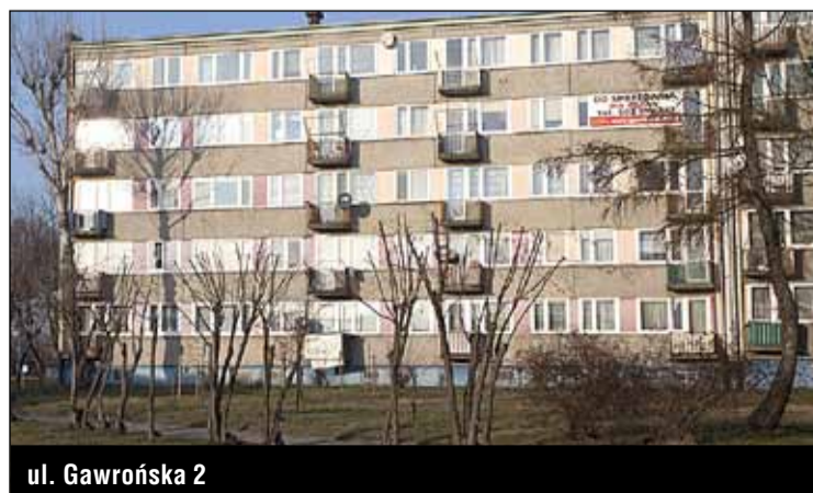
ul. Gawrońska 2