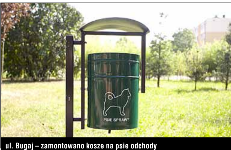
ul. Bugaj – zamontowano kosze na psie odchody

Łącznie w pięciu administracjach w 2016 r. kompleksowej termomodernizacji poddano 12 budynków, w 58 wymieniono oświetlenie na energooszczędne, do 8 budynków doprowadzono ciepłą wodę użytkową z sieci miejskiej, przeprowadzono prace malarskie w 21 blokach na powierzchni 29989,74 m kw., pomalowano również 48 wiatrołapów w 15 budynkach, w 145 blokach wymieniono 1.582 sztuki stolarki okiennej i drzwiowej, w 17 budynkach wymieniono 66 drzwi wejściowych do klatek schodowych, w 8 blokach wyremontowano 74 balkony, przeprowadzono roboty drogowe na powierzchni 8130,55 m kw., wymieniono 9 podestów wejściowych do klatek schodowych, 120 m.b. rynien i pasów nadrynnowych. W 7 budynkach zamontowano zawory na pionach C.O., w 63 budynkach zamontowano 253 nowe tablice informacyjne, przy 80 budynkach ustawiono 99 stojaków na rowery, a przy 38 – 75 ławek. Ponadto ustawiono 37 pergoli śmietnikowych, 48 nowych koszy na śmieci, 176 m.b. płotków drewnianych, powstały 2 nowe place zabaw, a na innych ustawiono 8 nowych urządzeń zabawowych, 2.814 m kw. dachów pokryto papą termozgrzewalną.