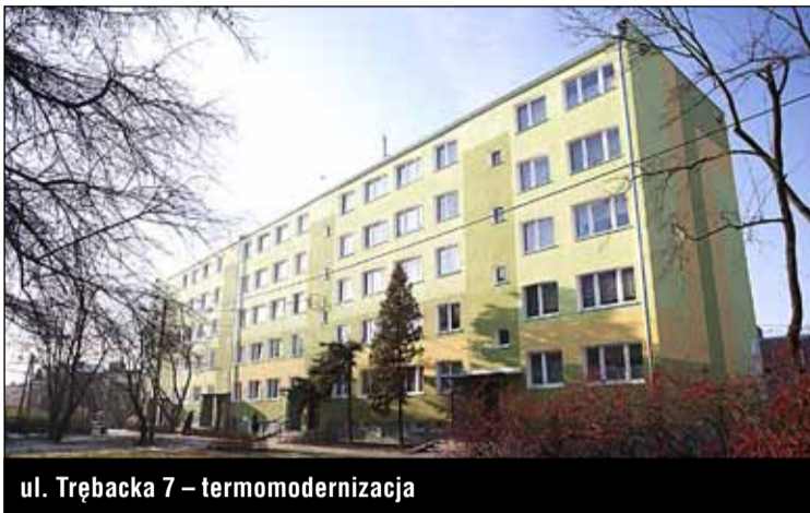
ul. Trębacka 7 – termomodernizacja