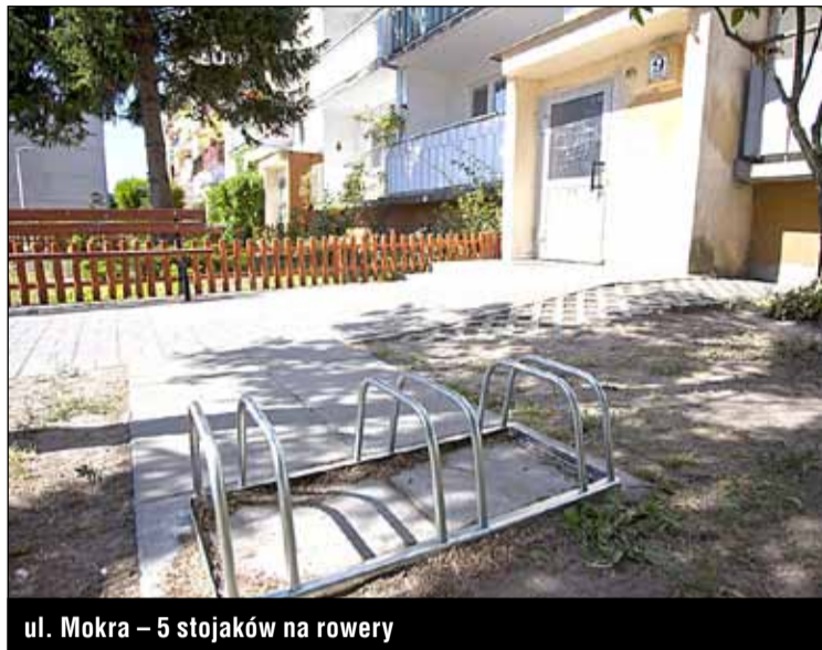
ul. Mokra – 5 stojaków na rowery