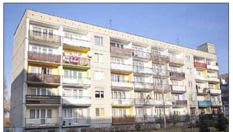
ul. Mokra 21