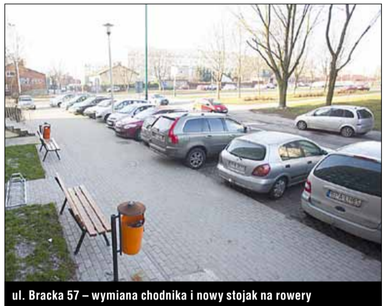
ul. Bracka 57 – wymiana chodnika i nowy stojak na rowery