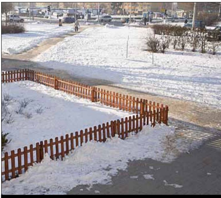
ul. Nawrockiego – wymiana chodników z płyt na kostkę brukową

Wymieniono oprawy i źródła światła na energooszczędne typu