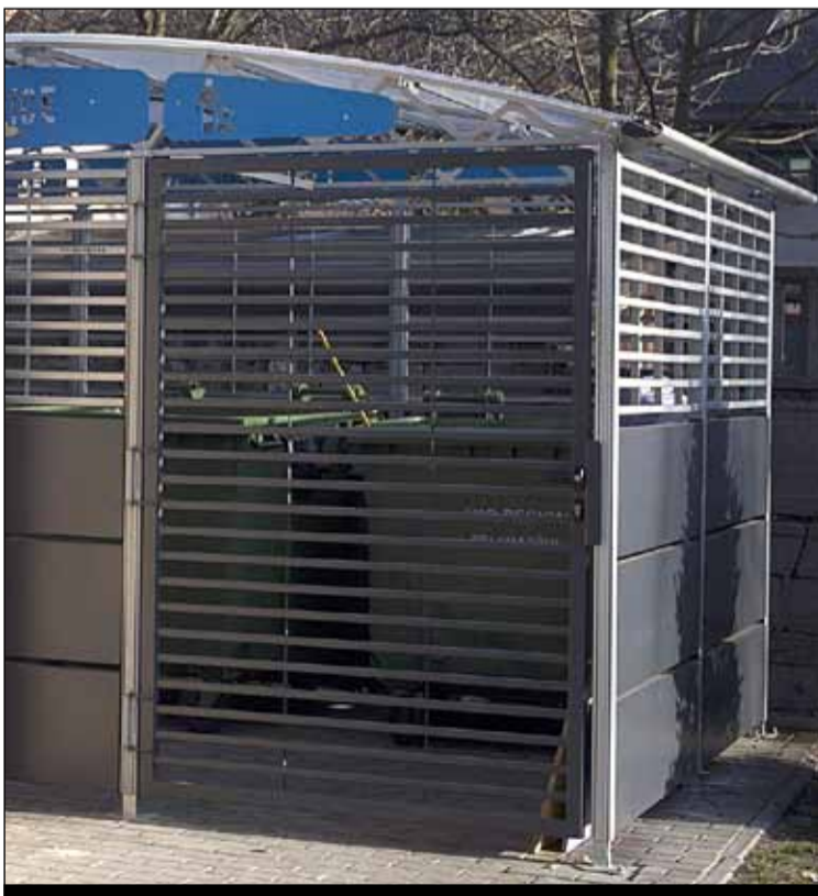
ul. Wyszyńskiego 8 – stanęła pergola śmietnikowa

► św. Rocha 5 i 5a – 1 sztuka ► Wyszyńskiego 8 – 1 sztuka ► Cicha 37 – 1 sztuka ► Wyszyńskiego 3 – 1 sztuka ► Cicha 51 – 1 sztuka (ponowny montaż po spaleniu pergoli w 2015 r.)