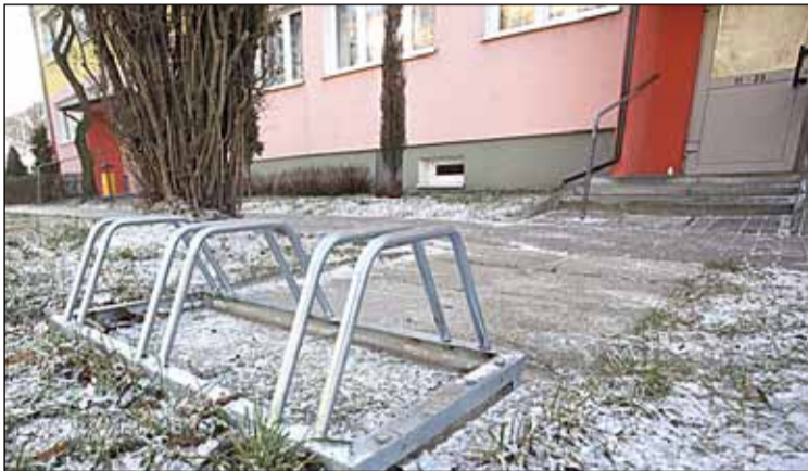
ul. Wiejska 30 – zamontowano stojak rowerowy