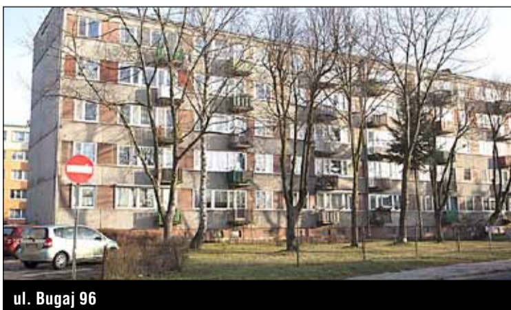
ul. Bugaj 96