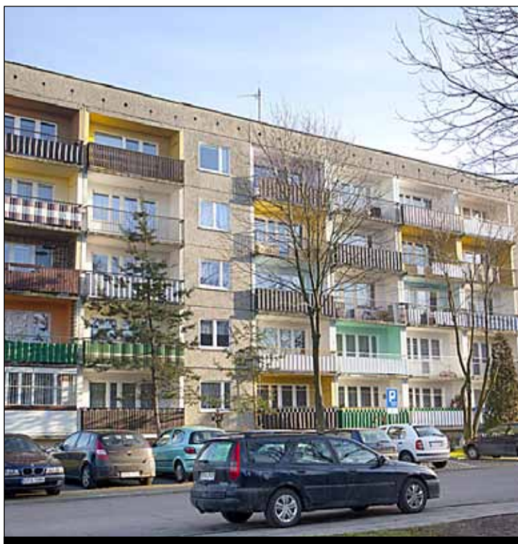
ul. Mokra 17 – wymiana nawierzchni chodników