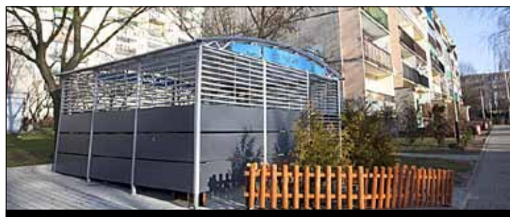
ul. Piotra Skargi 62 – nowa pergola śmietnikowa