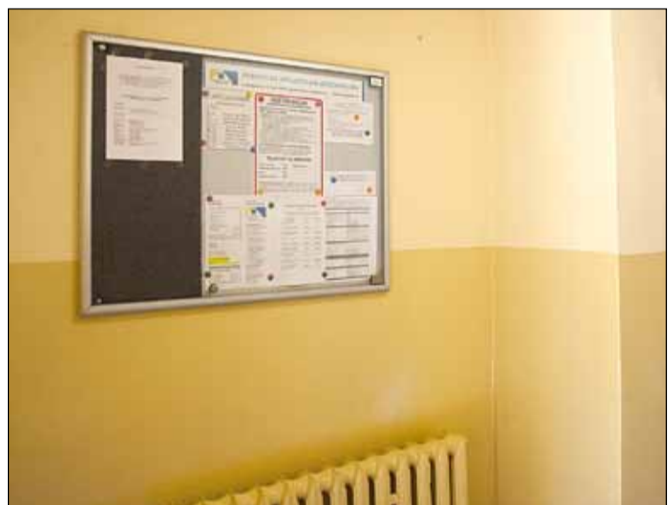
ul. Mokra 20 – nowa tablica informacyjna