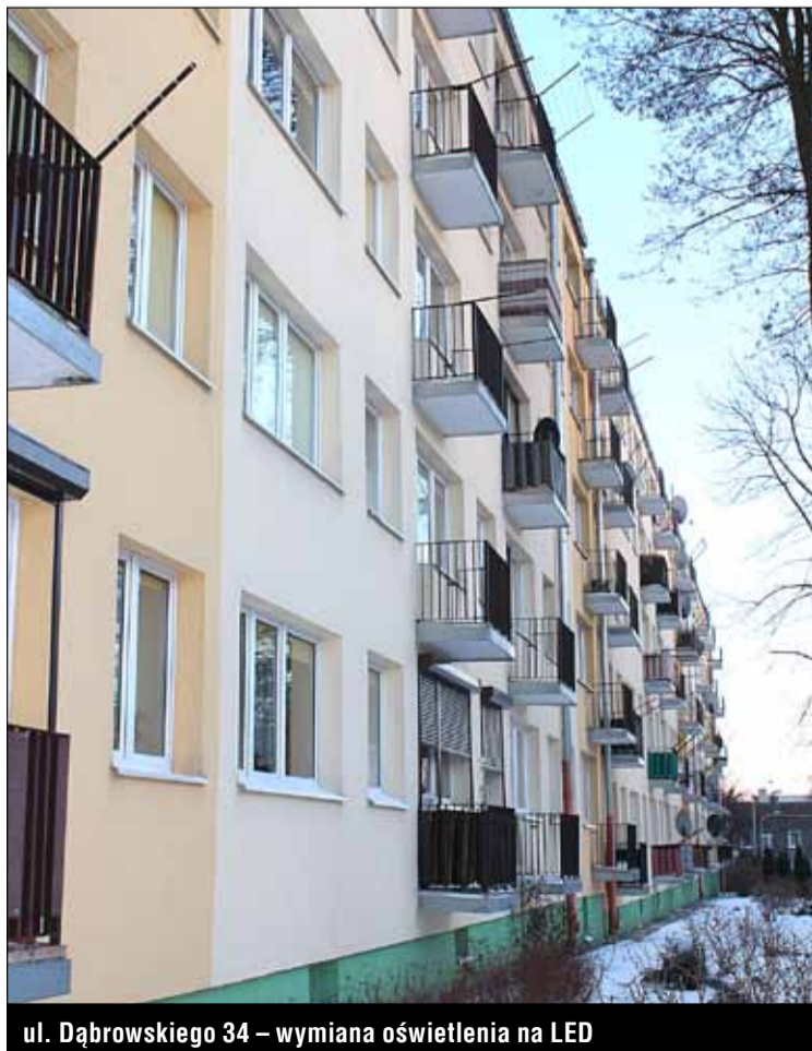
ul. Dąbrowskiego 34 – wymiana oświetlenia na LED