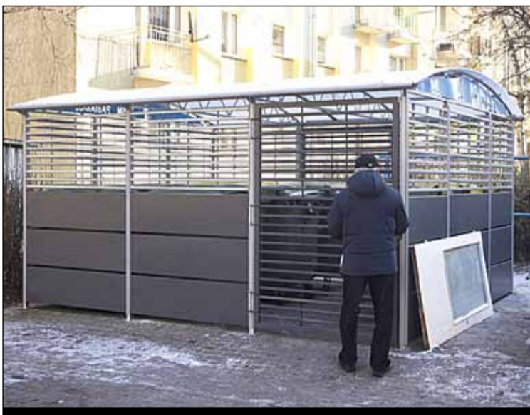
ul. Wileńska 39 – stanęła pergola śmietnikowa

Łaska 90, 92, 94, 96 i Niecała 1/ Niecała 3 oraz Łaska 46/48 – uzupełniono ubytki w asfalcie – 2300 kg masy asfaltowej na zimno.