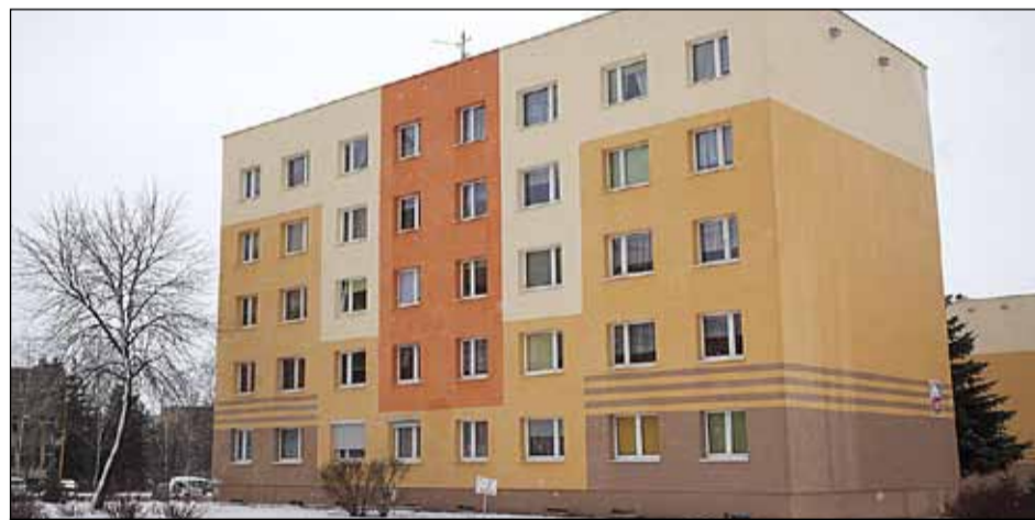
ul. Grota-Roweckiego 31 – termomodernizacja