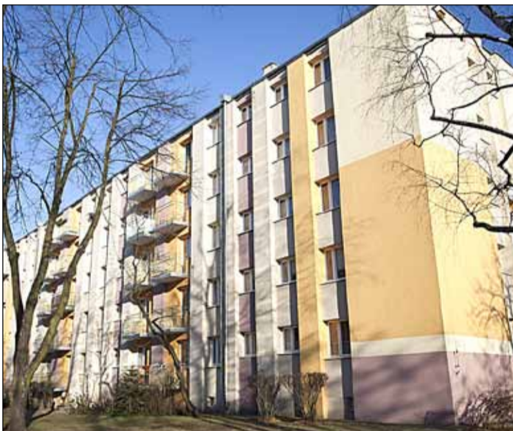
ul. Moniuszki 157 – remont posadzek 23 balkonów