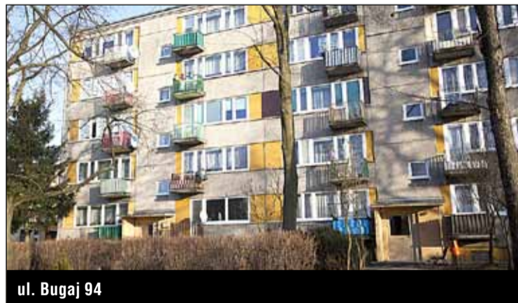
ul. Bugaj 94