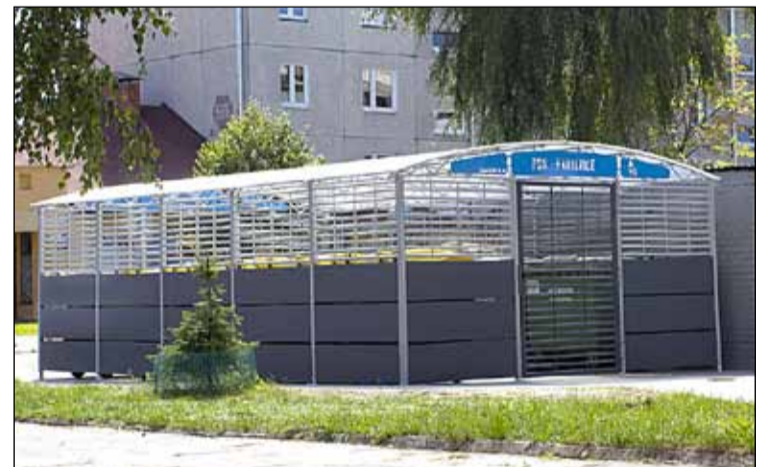
ul. Wajsówny – pergola śmietnikowa

▶ Wajsówny 21 – utwardzenie terenu pod pergolę śmietnikową i dojścia do pergoli – 38,4 m kw.