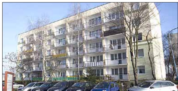
ul. Narcyza Gryzla 8 – termomodernizacja