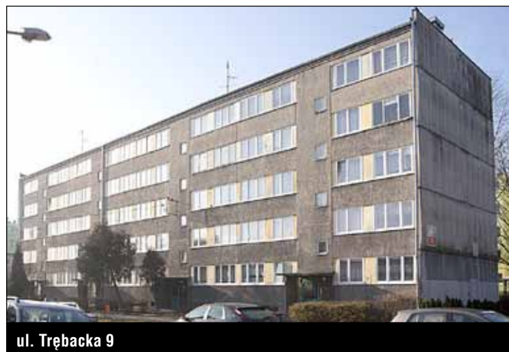
ul. Trębacka 9