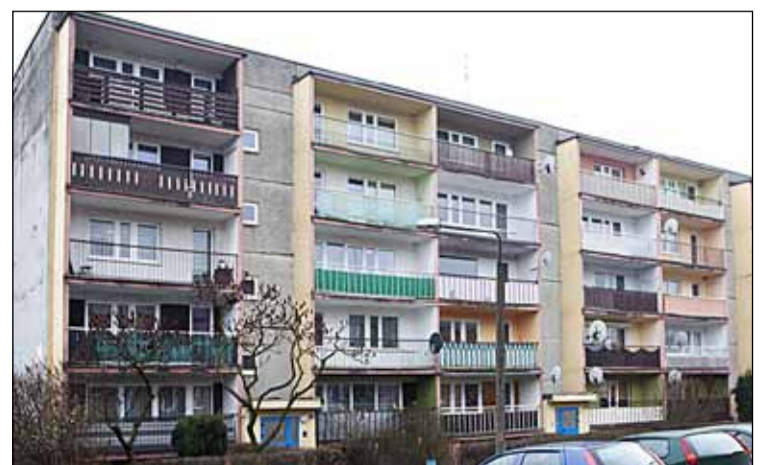
ul. Podleśna 3a