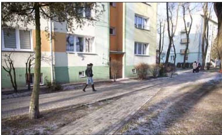
ul. Cicha 32 – nowy chodnik

► Cicha 32 – wymiana nawierzchni chodnika z płyt betonowych na kostkę betonową, utwardzenie alejek – 391 m kw.