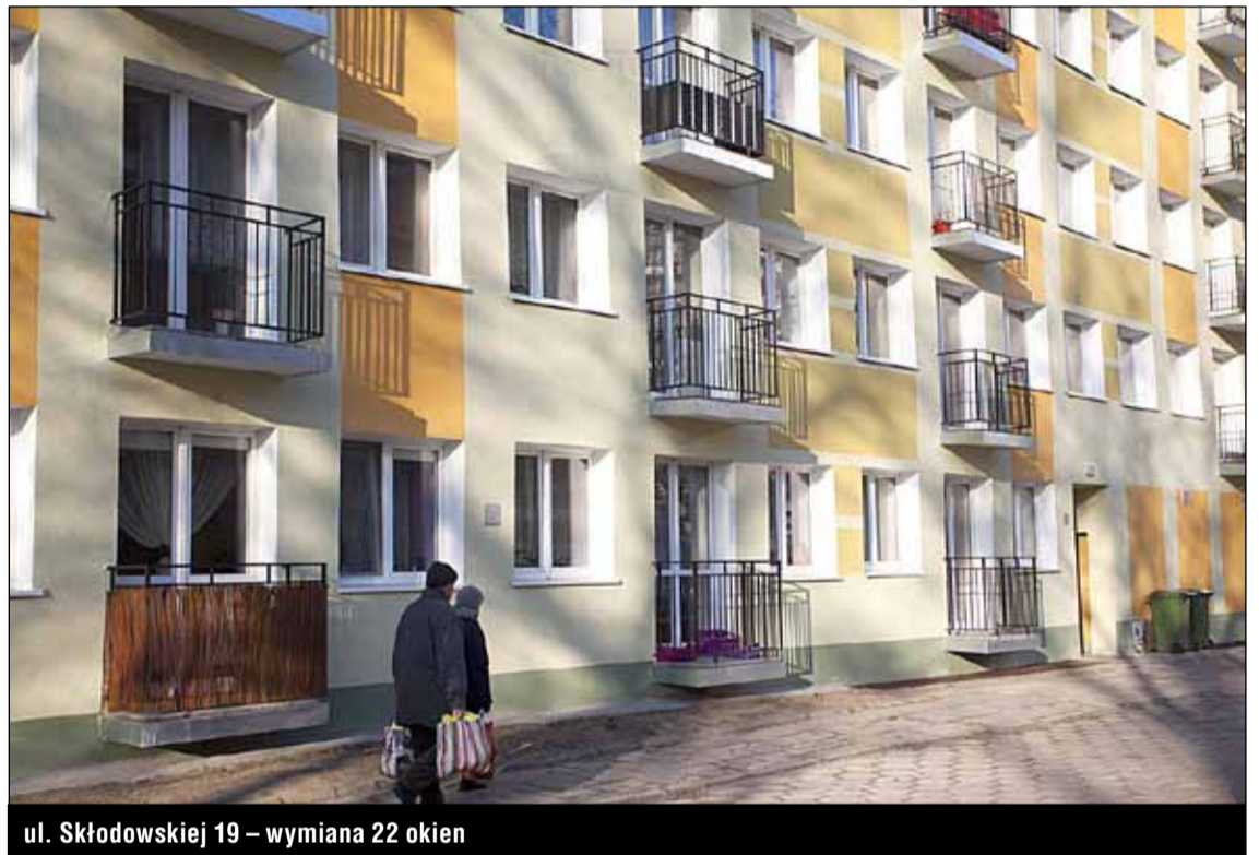
ul. Skłodowskiej 19 – wymiana 22 okien