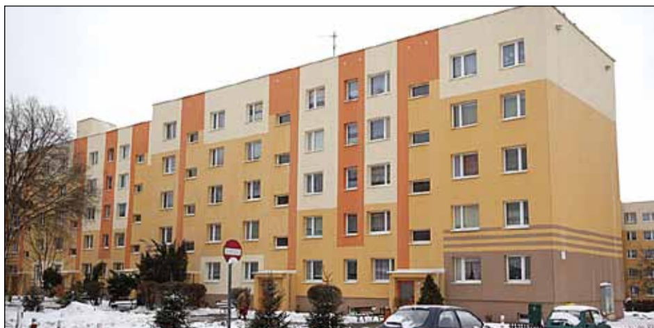
ul. Mokra 14 – termomodernizacja