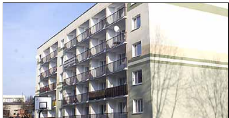
ul. Narcyza Gryzla 6 – termomodernizacja