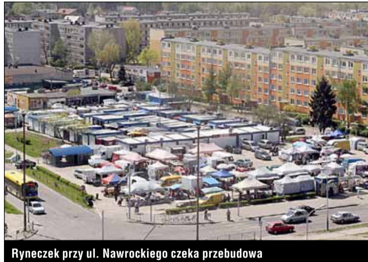
Rynek przy ul. Nawrockiego czeka przebudowa