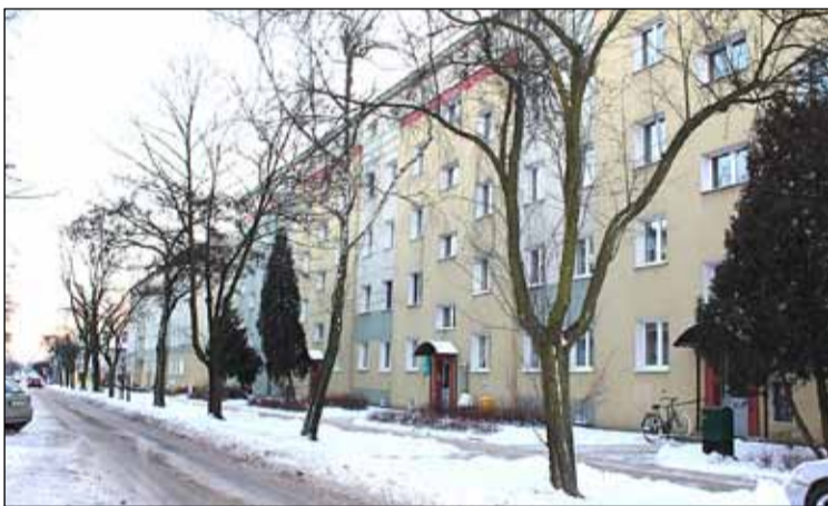
ul. Wyszyńskiego 9 – zamontowano tablice informacyjne

Wykonano instalację centralnej ciepłej wody użytkowej w budynku przy ulicy Zamkowej 18.