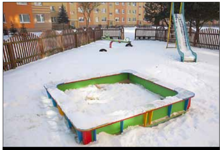
ul. Mokra 14 – wymieniono piaskownicę

Ustawiono nowe urządzenia zabawowe oraz naprawiono