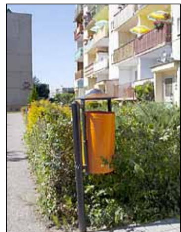
ul. Mokra – osiem nowych koszy