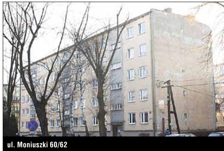
ul. Moniuszki 60/62