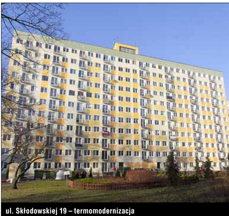
ul. Skłodowskiej 19 – termomodernizacja