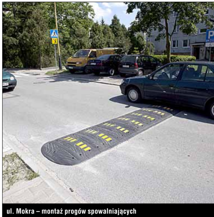
ul. Mokra – montaż progów spowalniających