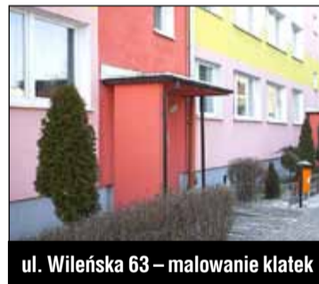
ul. Wileńska 63 – malowanie klatek