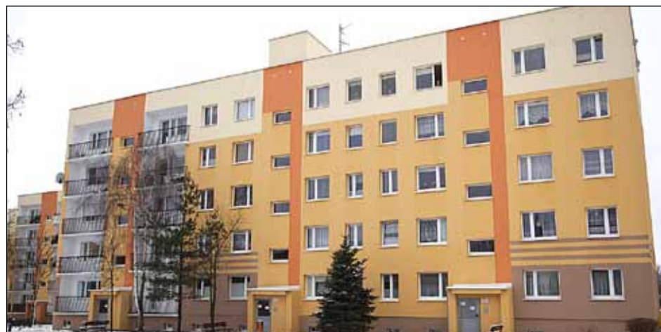
ul. Mokra 24 – termomodernizacja