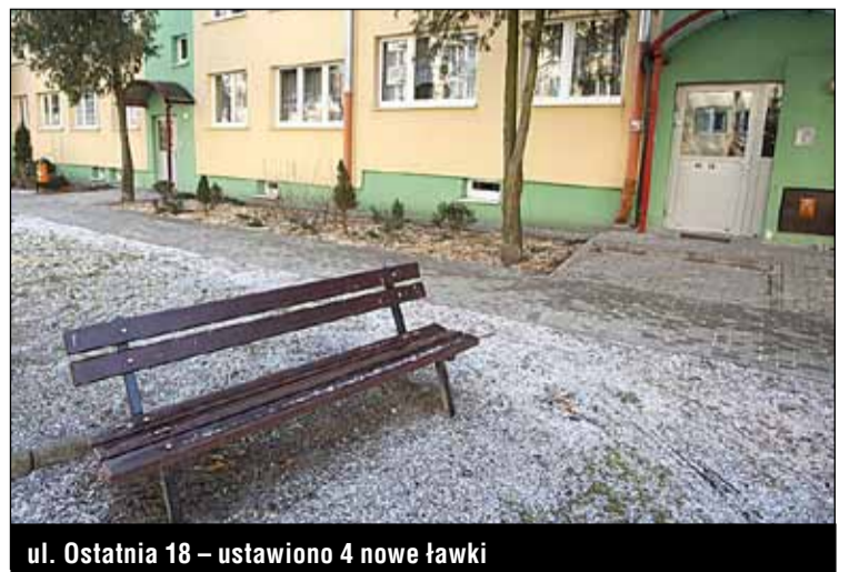
ul. Ostatnia 18 – ustawiono 4 nowe ławki