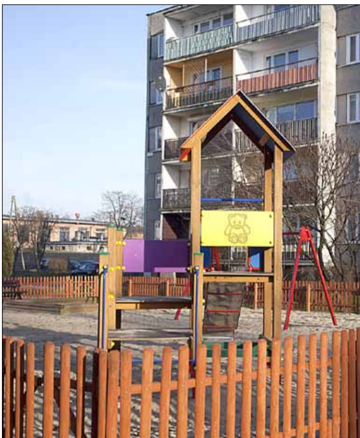
ul. Nawrockiego 22 – powstał nowy plac zabaw