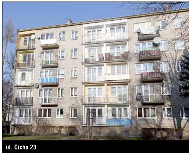
ul. Cicha 23