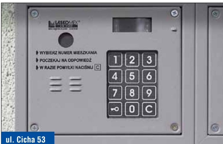
ul. Cicha 53

Wymieniono oprawy i źródła światła na energooszczędne typu LED sterowane czujnikami w czę-