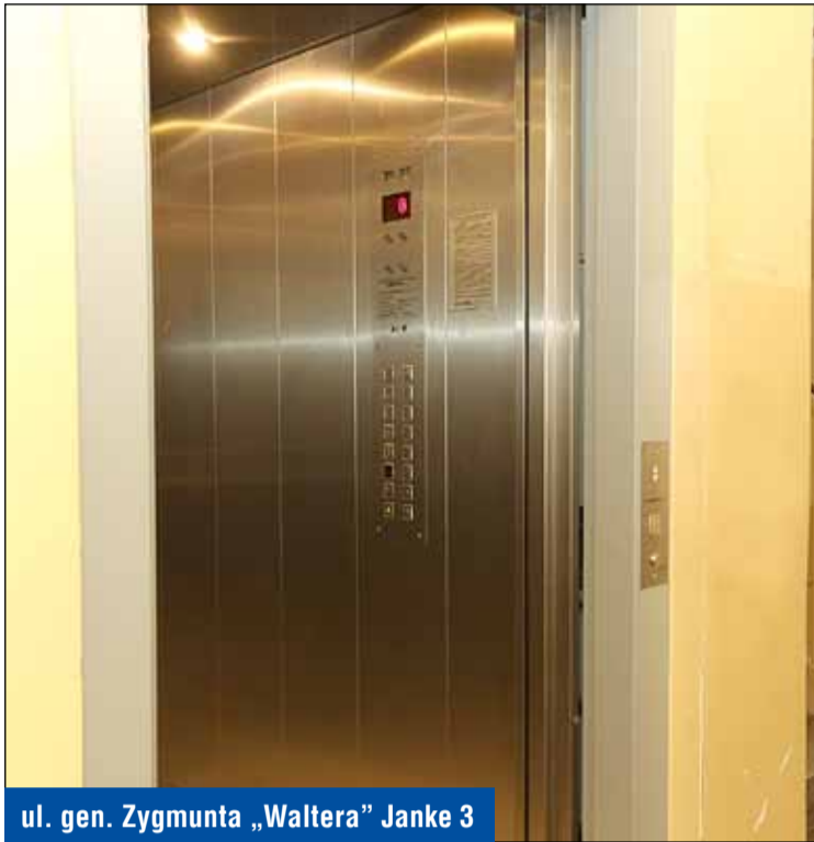
ul. gen. Zygmunta „Waltera” Janke 3