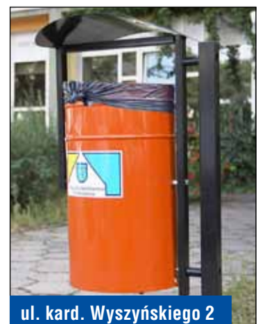
ul. kard. Wyszyńskiego 2