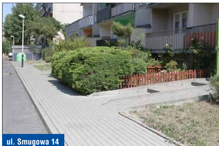
ul. Smugowa 14