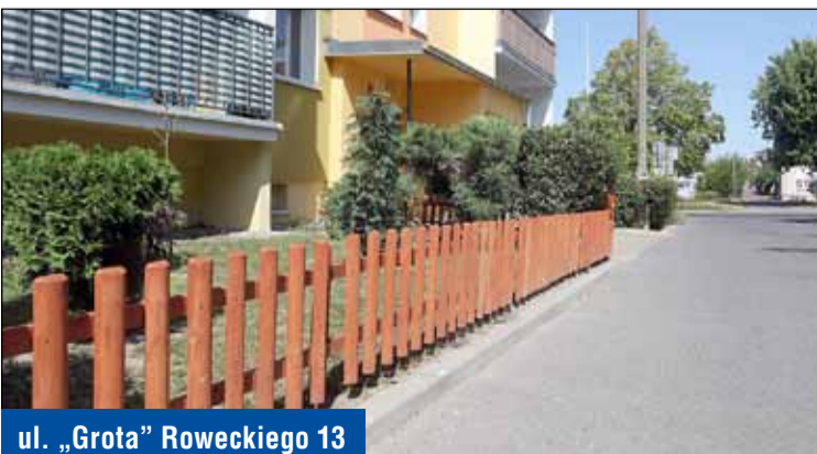
ul. „Grotą” Roweckiego 13