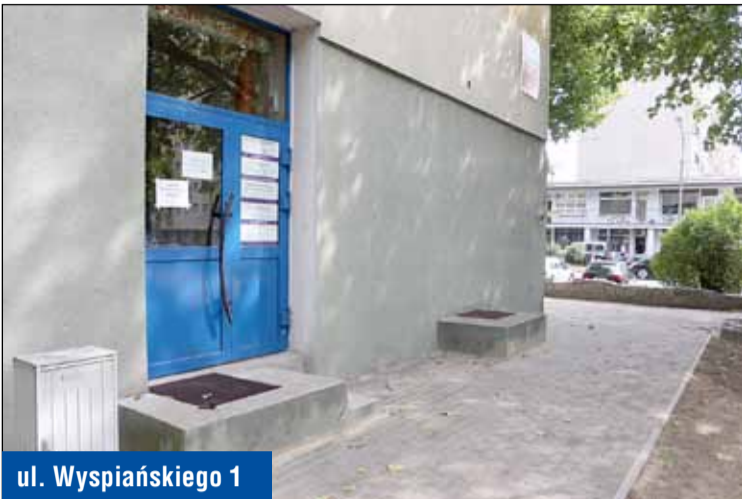
ul. Wyspiańskiego 1