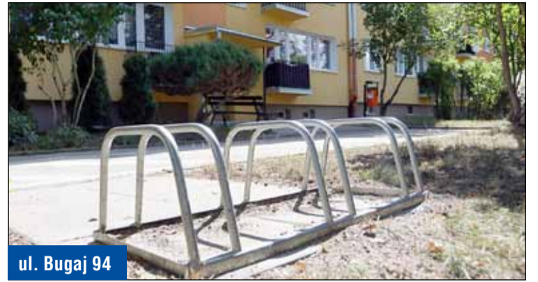
ul. Bugaj 94