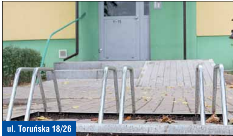
ul. Toruńska 18/26