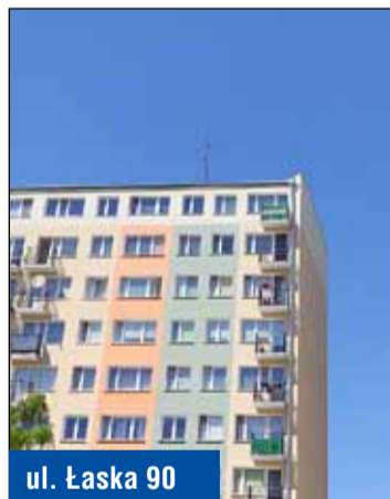
ul. Łaska 90