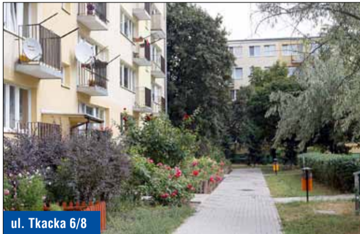
ul. Tkacka 6/8

na powierzchni 623 m kw. przy budynkach: