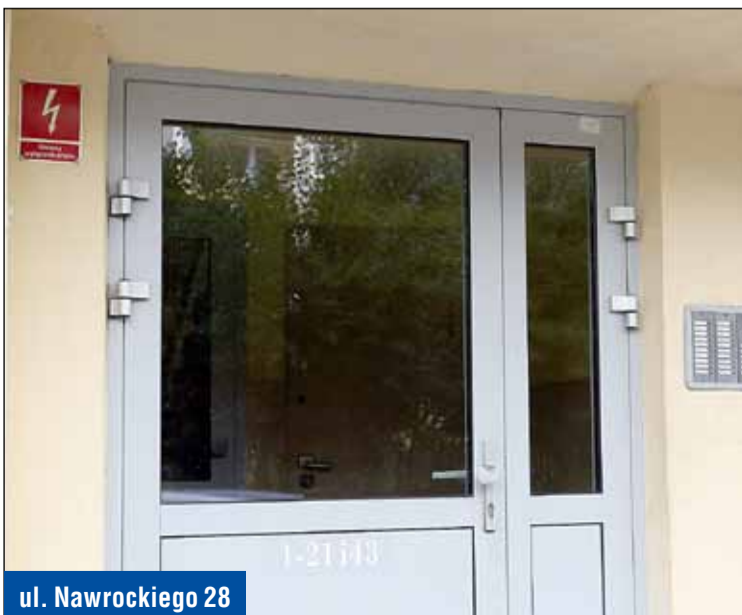
ul. Nawrockiego 28