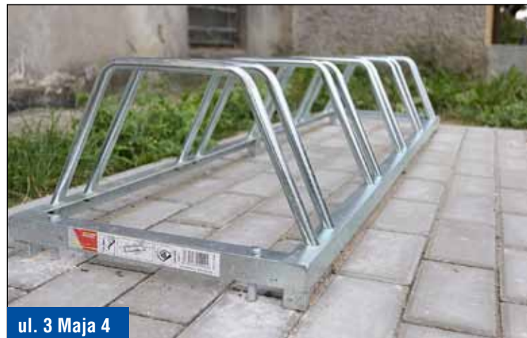
ul. 3 Maja 4