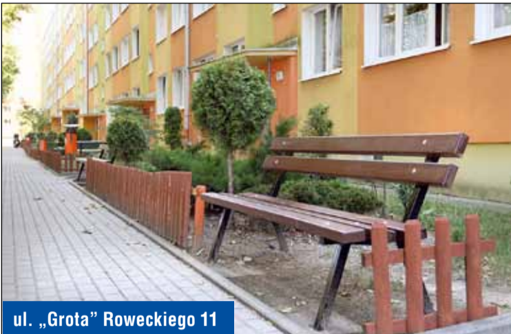
ul. „Grotą” Roweckiego 11