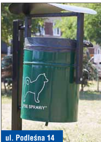
ul. Podleśna 14