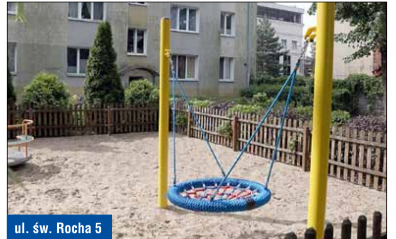
ul. św. Rocha 5