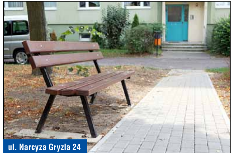
ul. Narcyza Gryzła 24