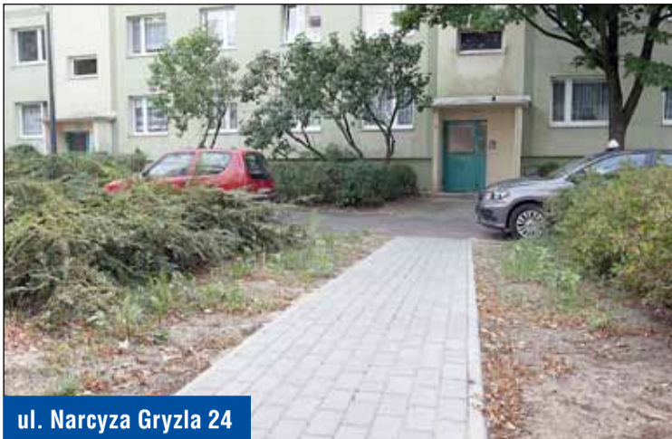
ul. Narcyza Gryzla 24

ściach wspólnych 16 budynków przy ulicach: