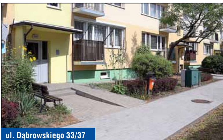
ul. Dąbrowskiego 33/37