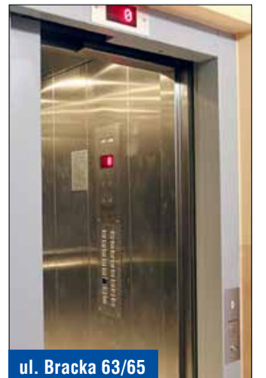
ul. Bracka 63/65