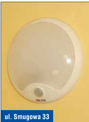
ul. Smugowa 33