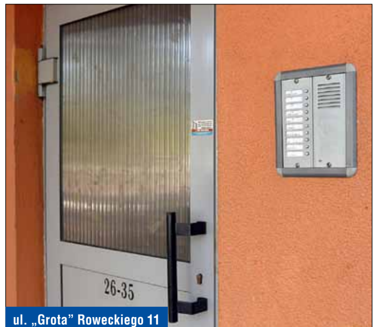
ul. „Grota” Roweckiego 11