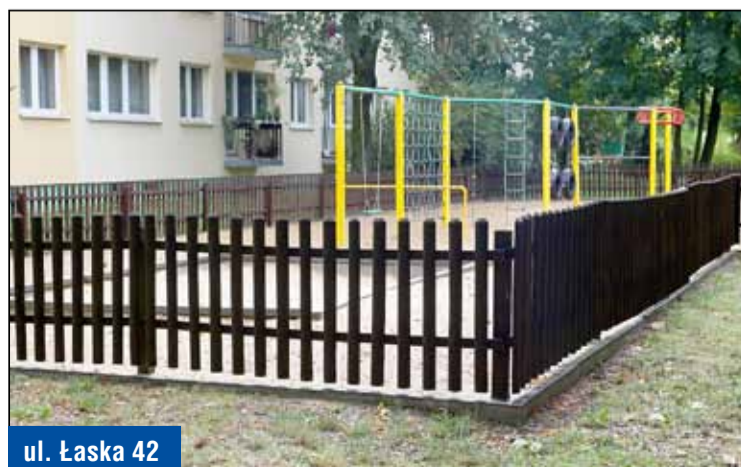
ul. Łaska 42