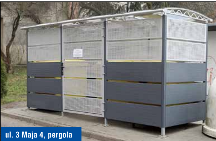
ul. 3 Maja 4, pergola