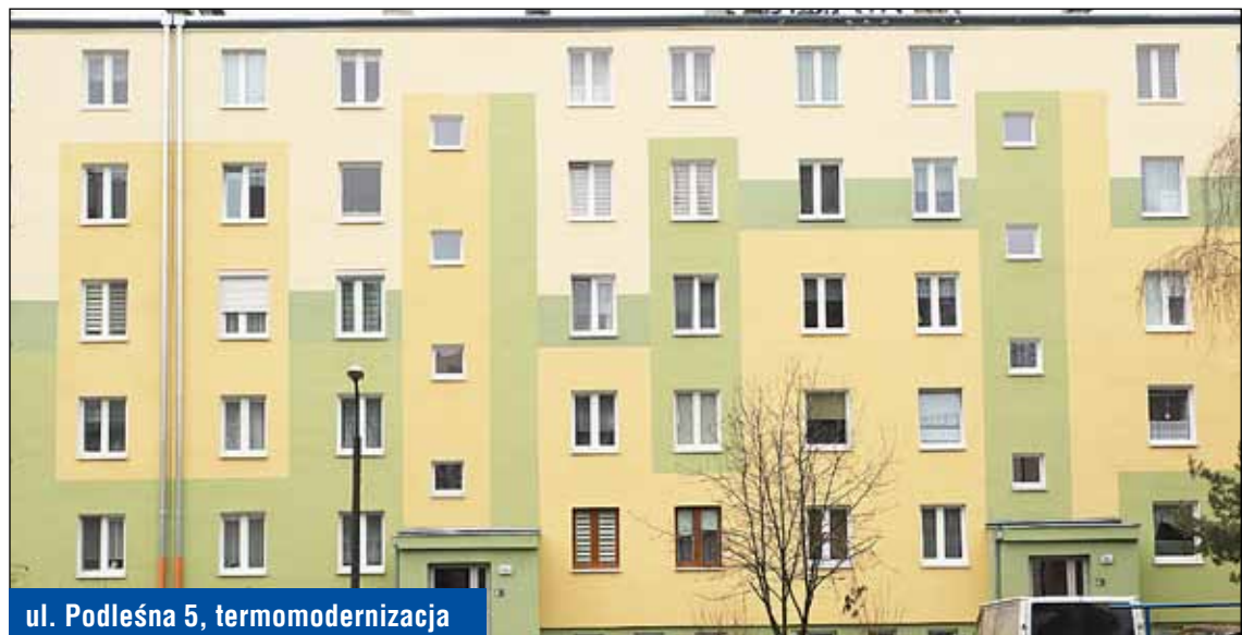
ul. Podleśna 5, termomodernizacja

Zamontowano na poddaszu budynków kratki wentylacyjne stanowiące zabezpieczenie przed