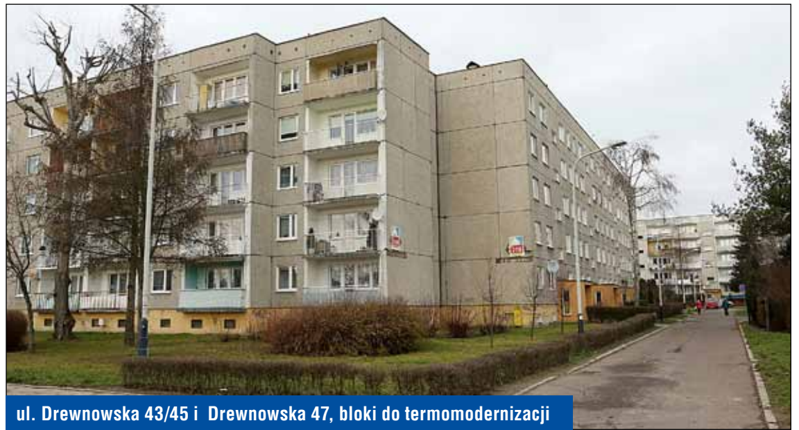
ul. Drewnowska 43/45 i Drewnowska 47, bloki do termomodernizacji

Remont, naprawa, konserwacja, przeglądy – zasoby administracji