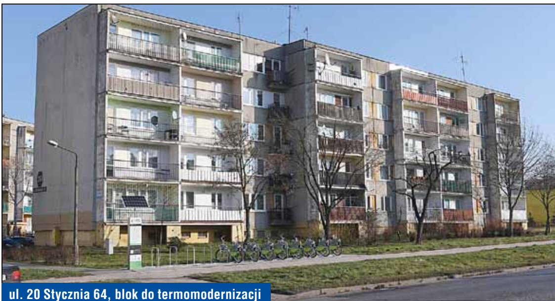
ul. 20 Stycznia 64, blok do termomodernizacji