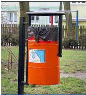
ul. Cicha 32, kosz na śmieci

oraz zamontowano lampę w kl. V budynku przy ul. Jana Matejki 37