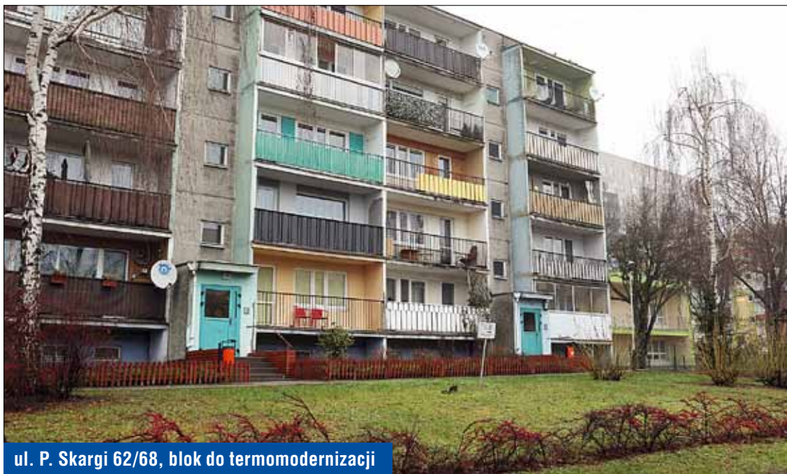
ul. P. Skargi 62/68, blok do termomodernizacji

Z wyrazami szacunku Zarząd Pabianickiej Spółdzielni Mieszkaniowej