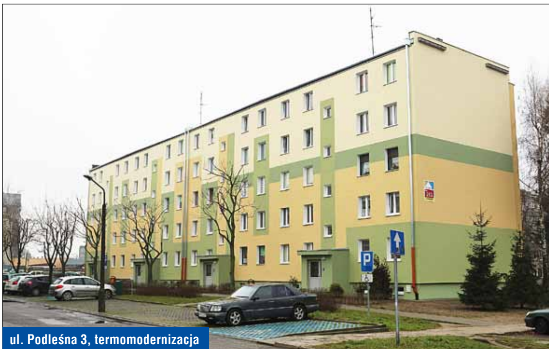
ul. Podleśna 3, termomodernizacja