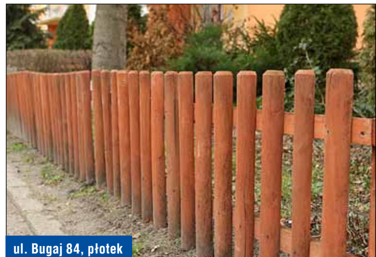
ul. Bugaj 84, płotek