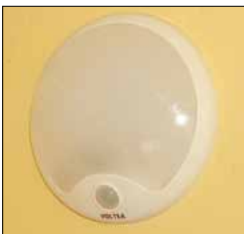
ul. Wileńska 53, oprawa typu LED