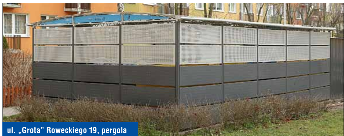
ul. „Grota” Roweckiego 19, pergola