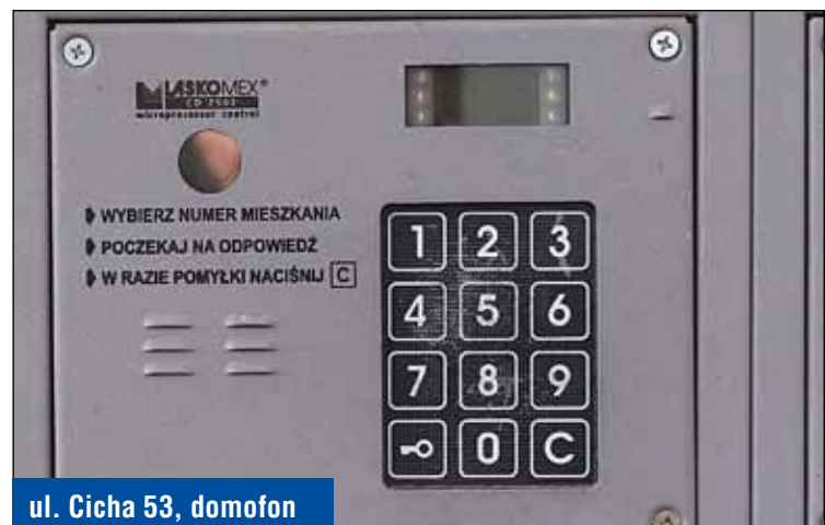
ul. Cicha 53, domofon