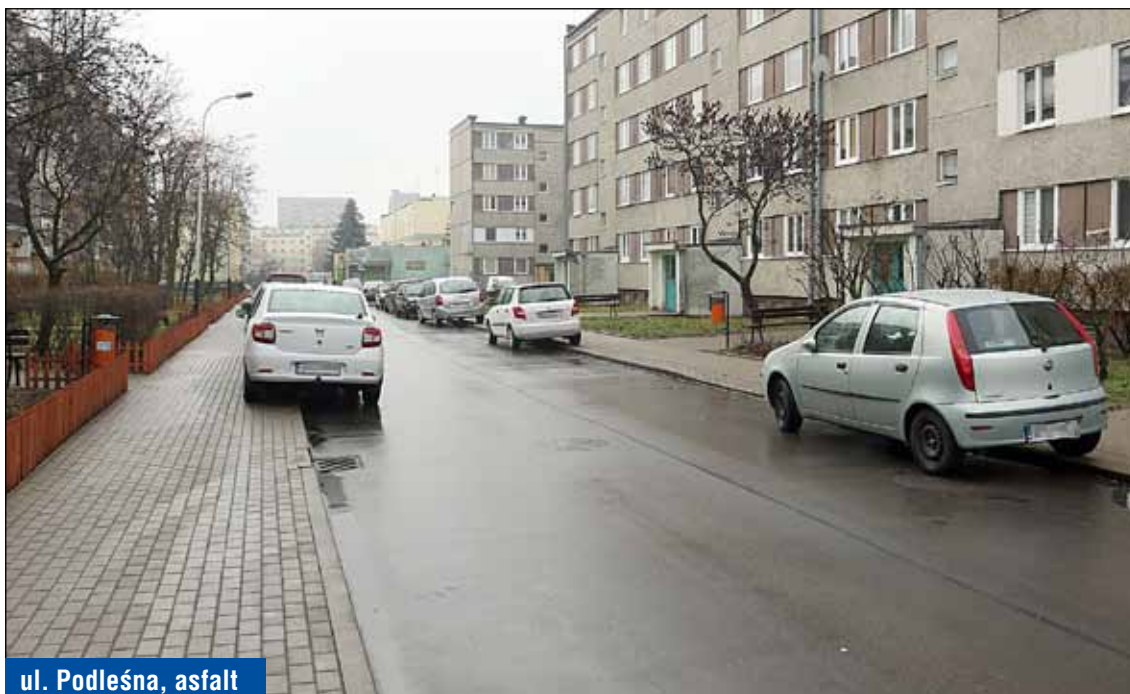
ul. Podleśna, asfalt