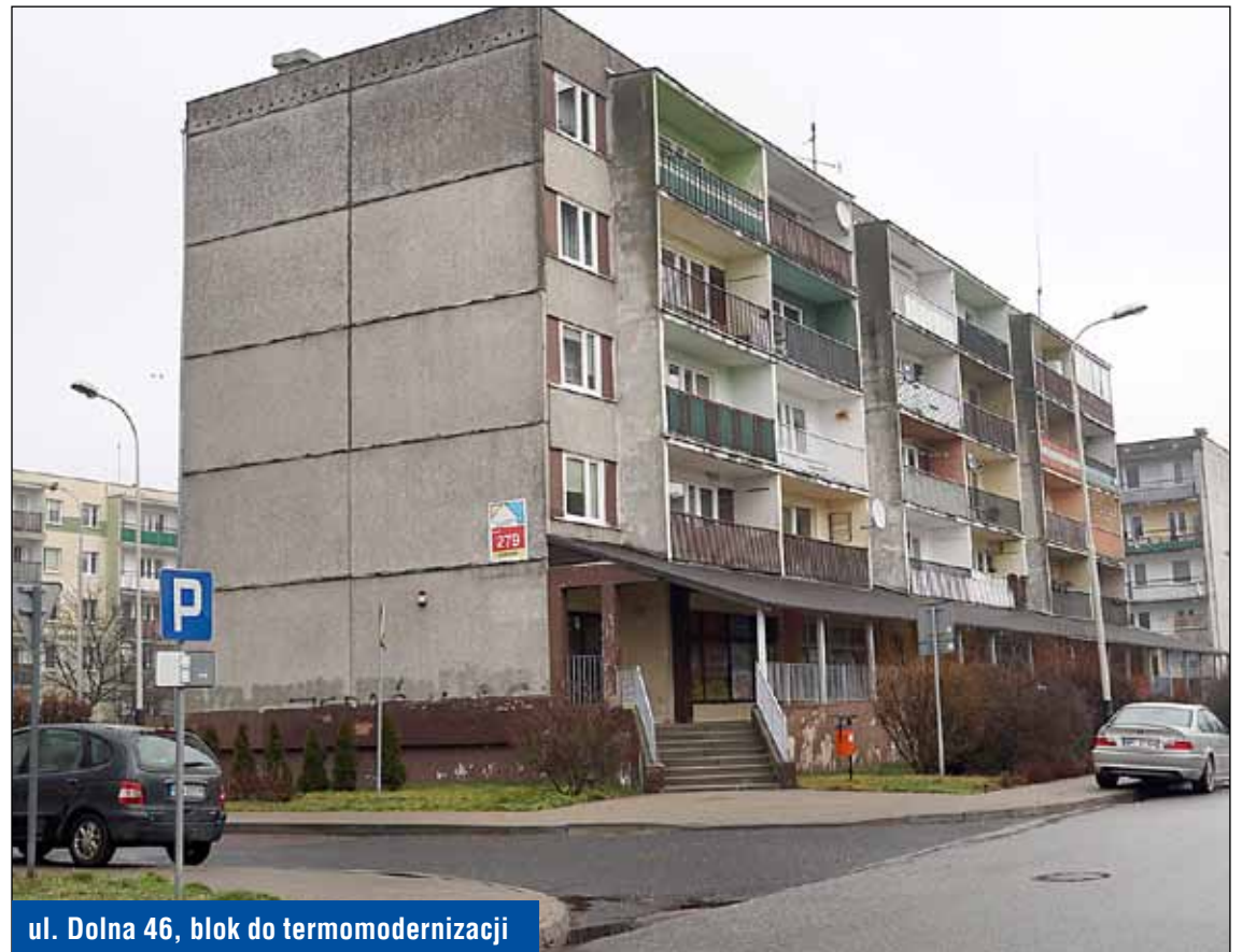
ul. Dolna 46, blok do termomodernizacji