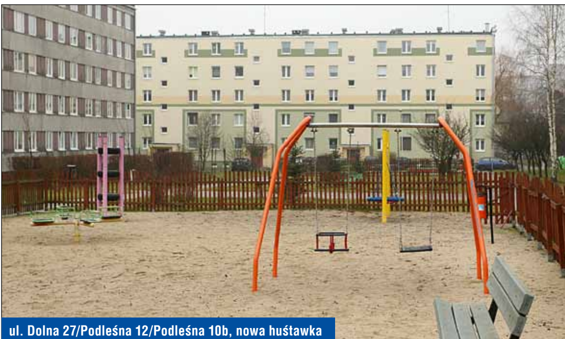
ul. Dolna 27/Podleśna 12/Podleśna 10b, nowa huśtawka