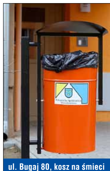
ul. Bugaj 80, kosz na śmieci