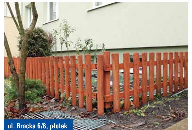
ul. Bracka 6/8, płotek