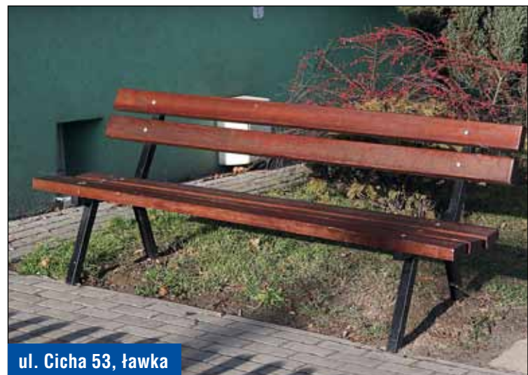
ul. Cicha 53, ławka