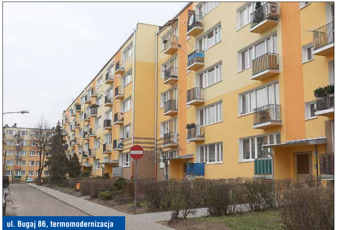
ul. Bugaj 86, termomodernizacja