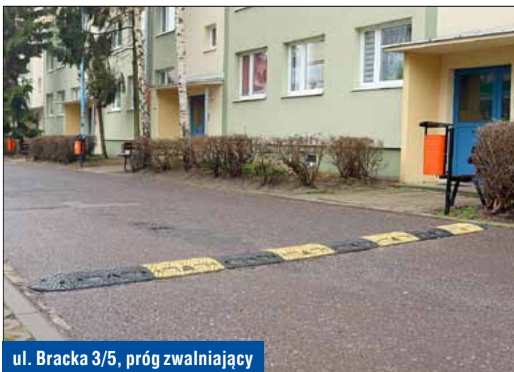
ul. Bracka 3/5, próg zwalniający