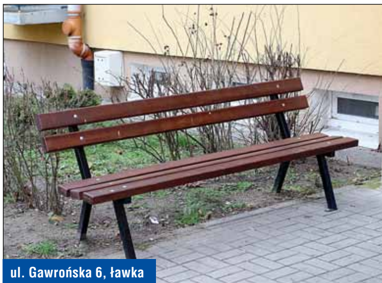
ul. Gawrońska 6, ławka