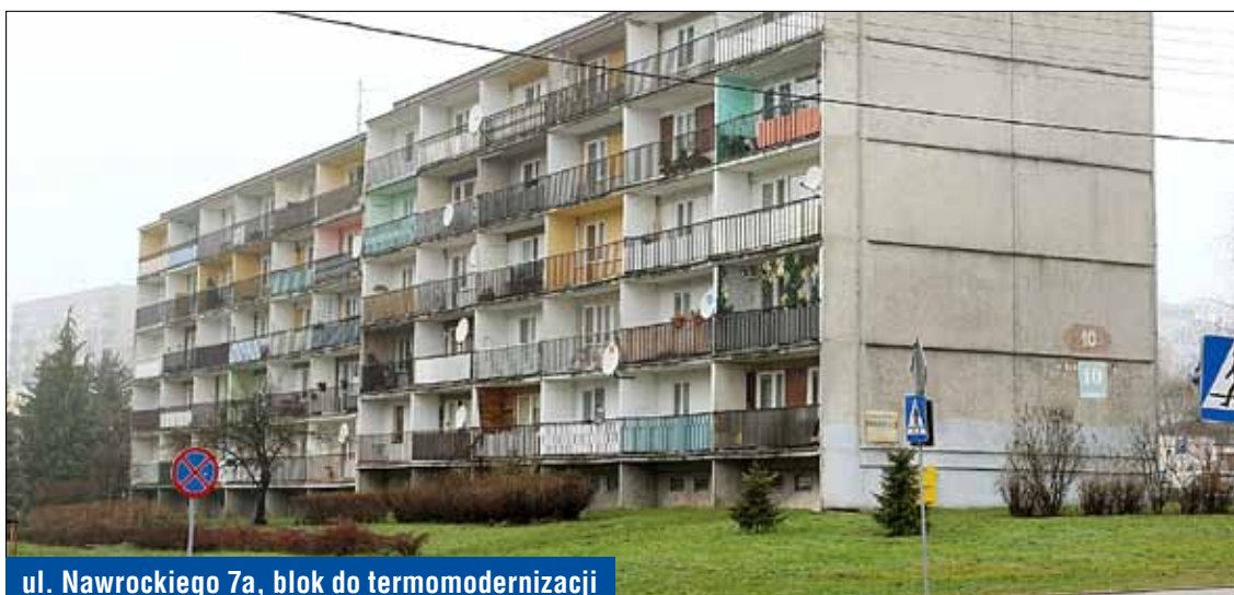
ul. Nawrockiego 7a, blok do termomodernizacji