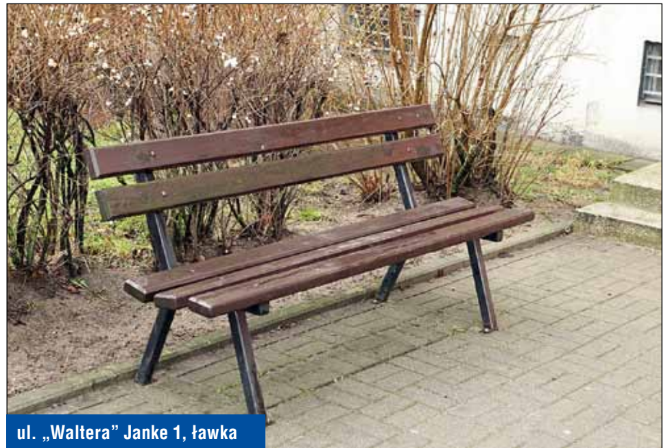
ul. „Waltera” Janke 1, ławka