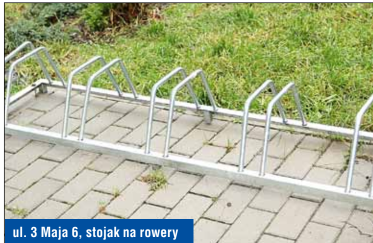
ul. 3 Maja 6, stojak na rowery