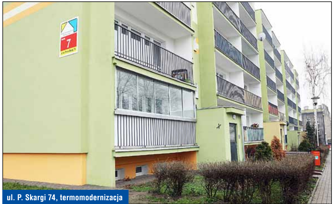
ul. P. Skargi 74, termomodernizacja