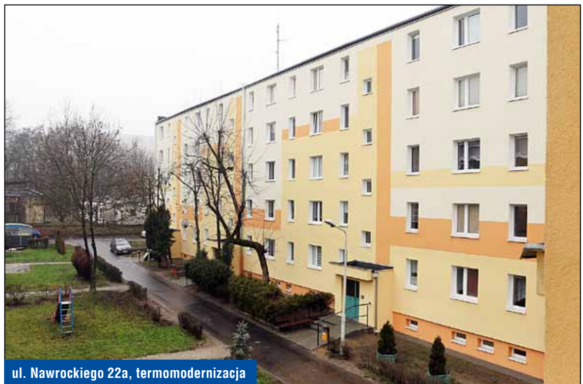
ul. Nawrockiego 22a, termomodernizacja

ul. Bracka 10/12 i ul. Bracka 14/16 – utwardzenie miejsc postojowych płytami ażurowymi – wspólna inwestycja z Urzędem Miejskim w Pabianicach