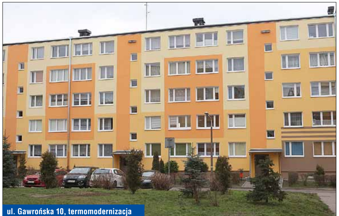
ul. Gawrońska 10, termomodernizacja