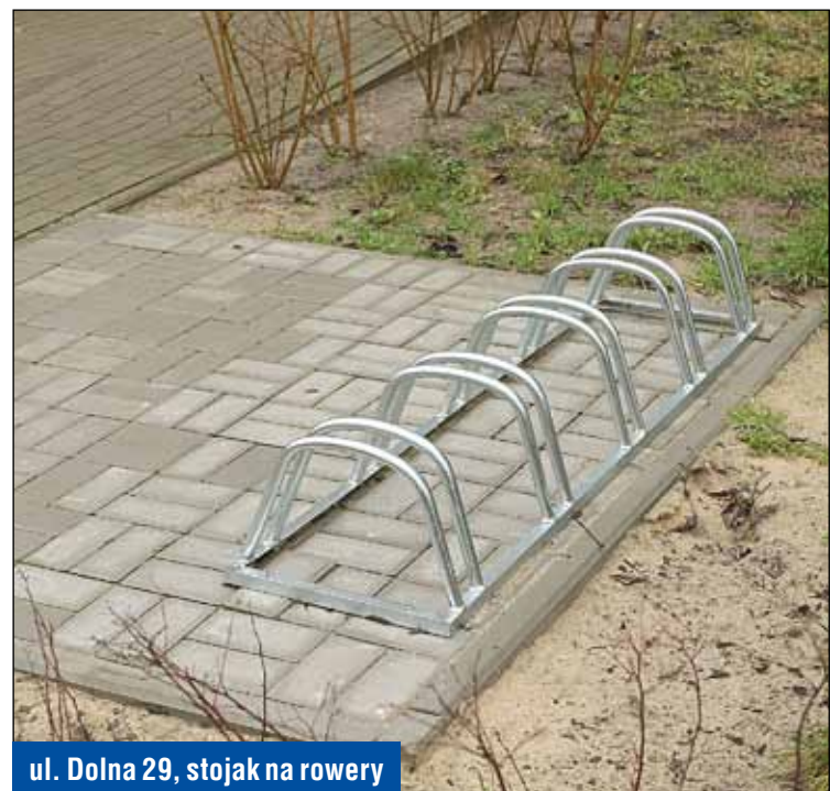
ul. Dolna 29, stojak na rowery