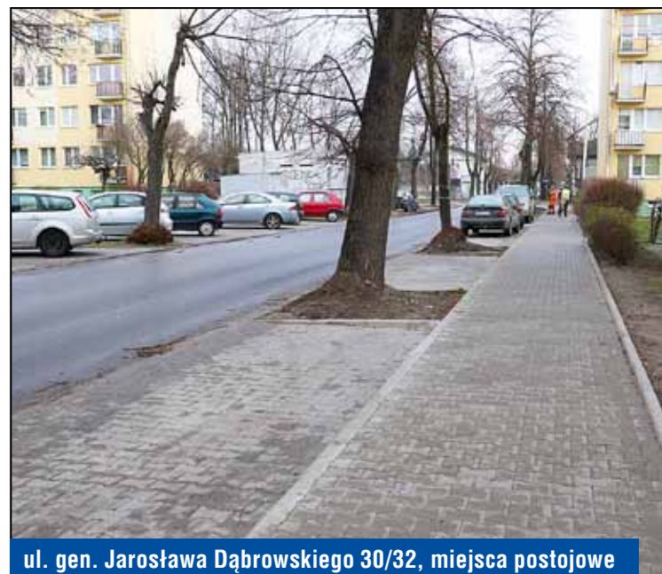
ul. gen. Jarosława Dąbrowskiego 30/32, miejsca postojowe