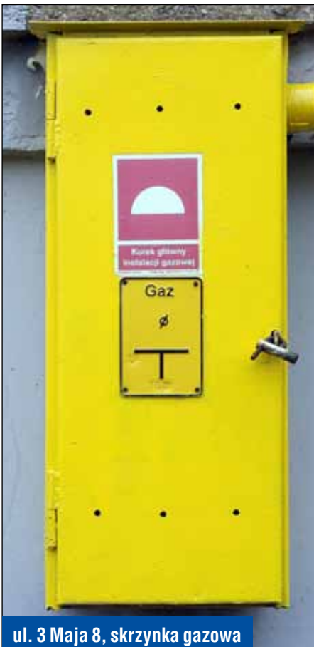
ul. 3 Maja 8, skrzynka gazowa