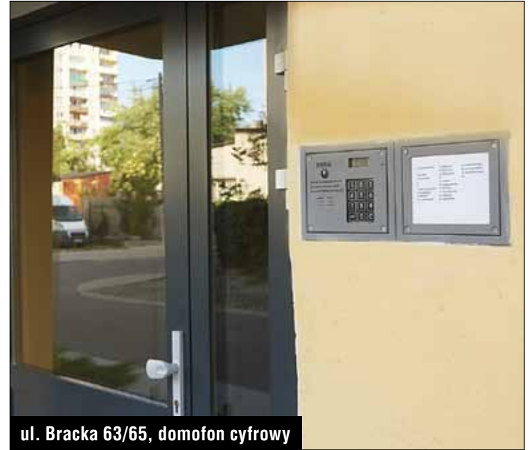
ul. Bracka 63/65, domofon cyfrowy

Otynkowano i pomalowano wiatrołapy na zewnątrz budynków przy ulicach: ▶ Brackiej 50