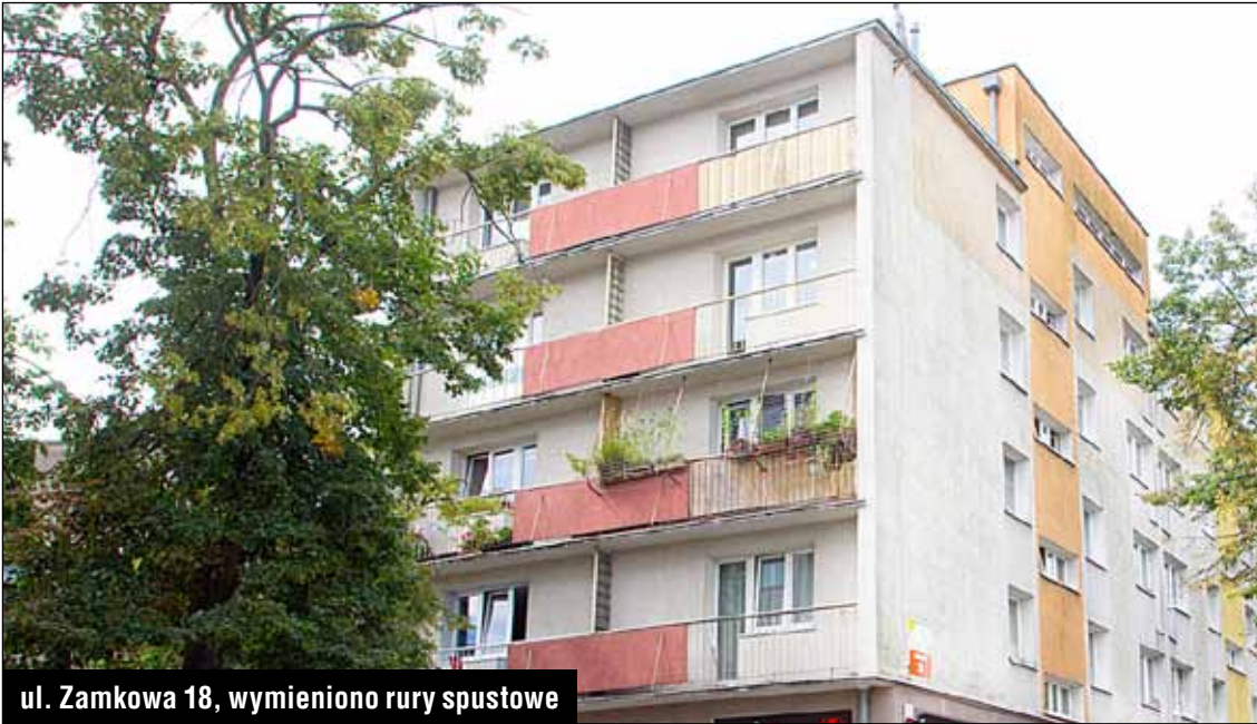
ul. Zamkowa 18, wymieniono rury spustowe