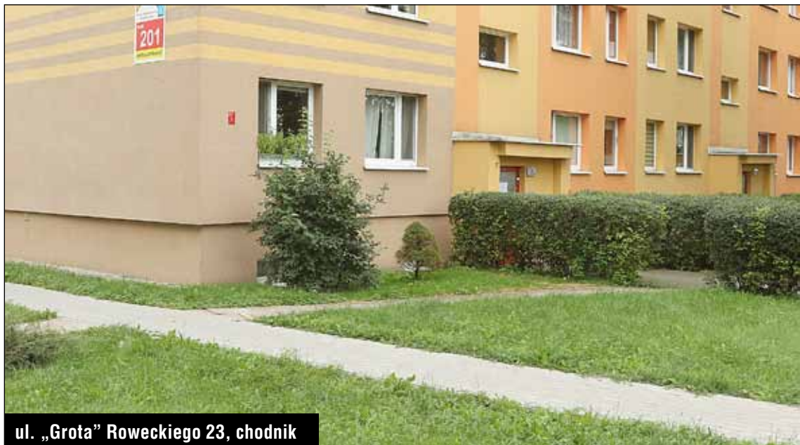
ul. „Grota” Roweckiego 23, chodnik