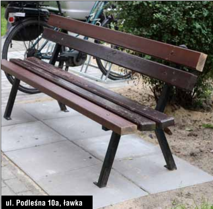
ul. Podleśna 10a, ławka