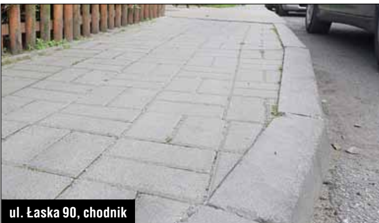
ul. Łaska 90, chodnik