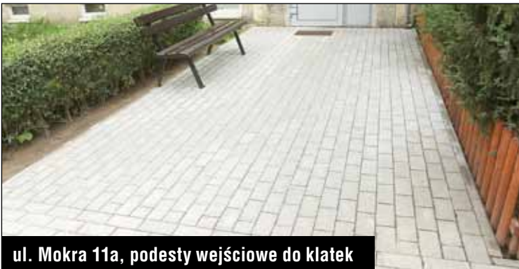
ul. Mokra 11a, podesty wejściowe do klatek