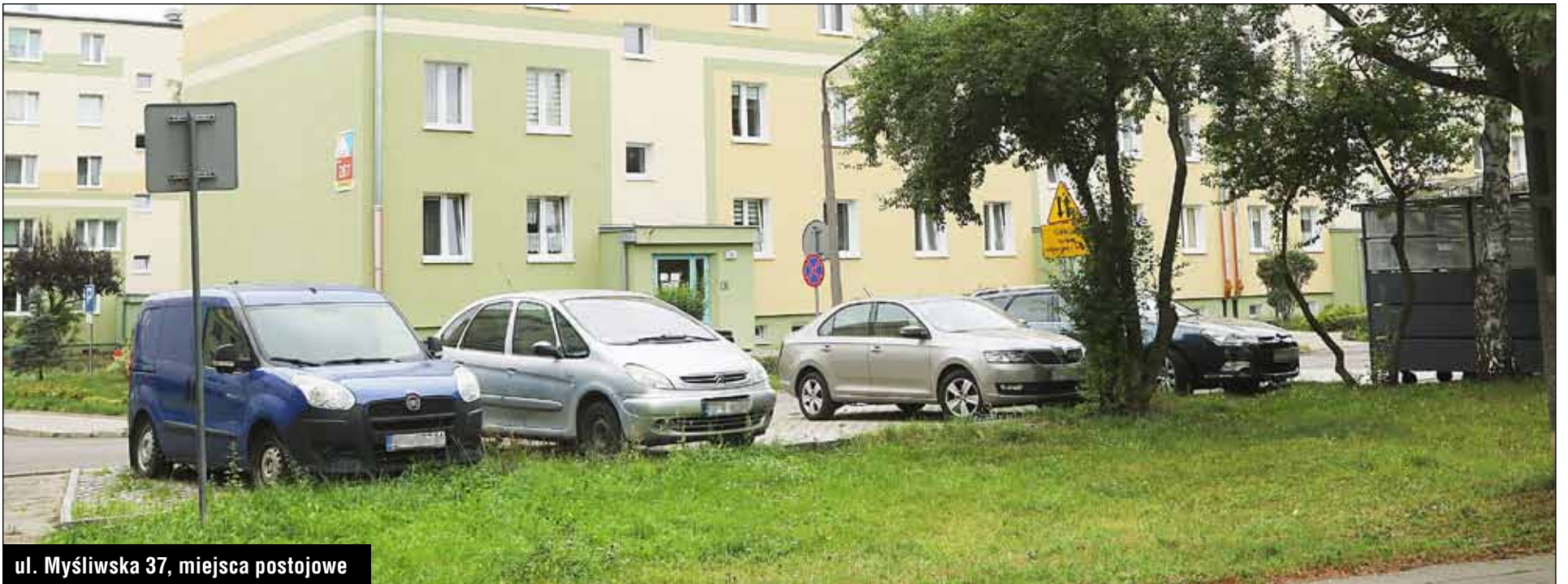
ul. Myśliwska 37, miejsca postojowe