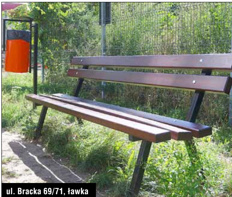
ul. Bracka 69/71, ławka