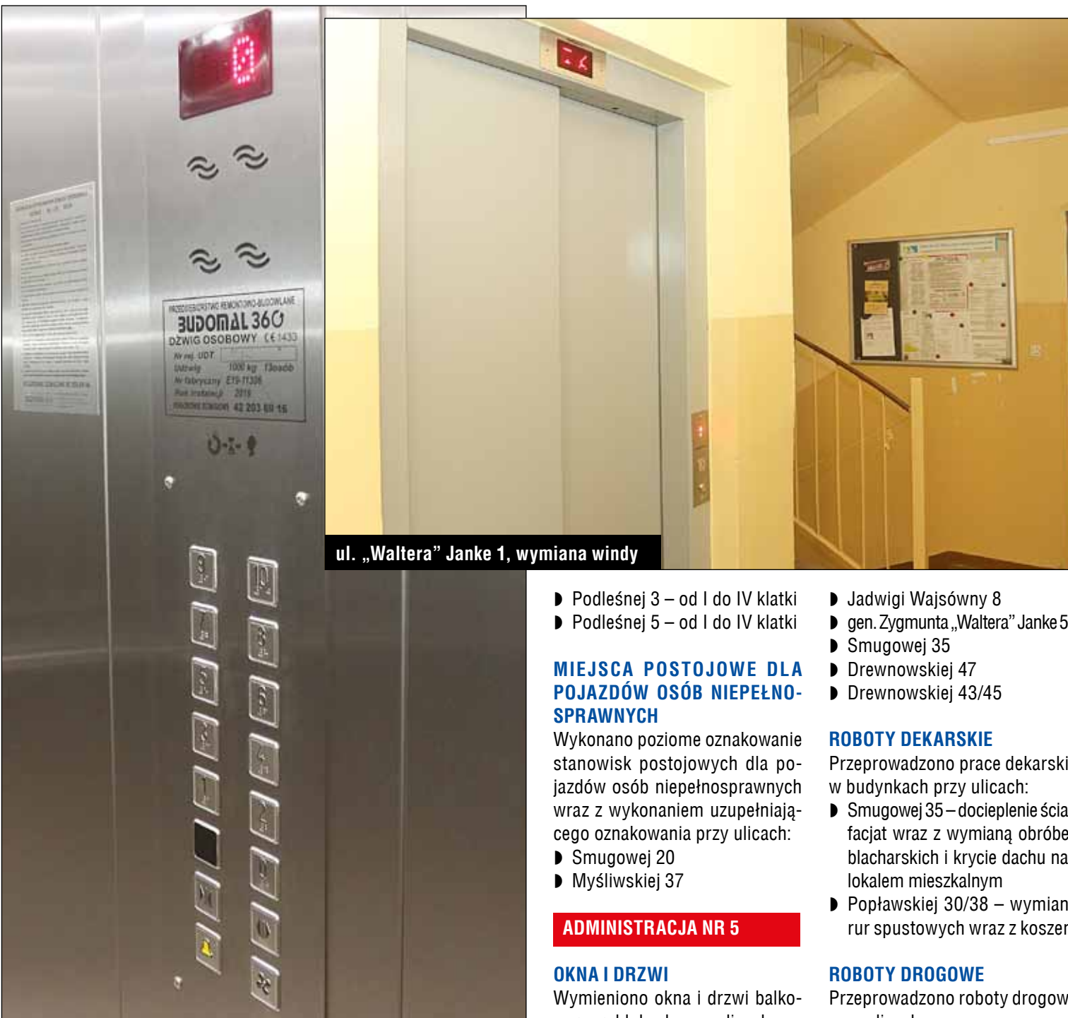
ul. „Waltera” Janke 1, wymiana windy