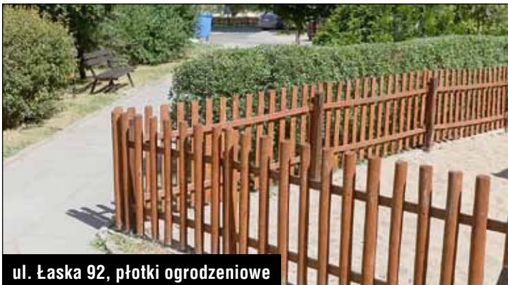
ul. Łaska 92, płotki ogrodzeniowe