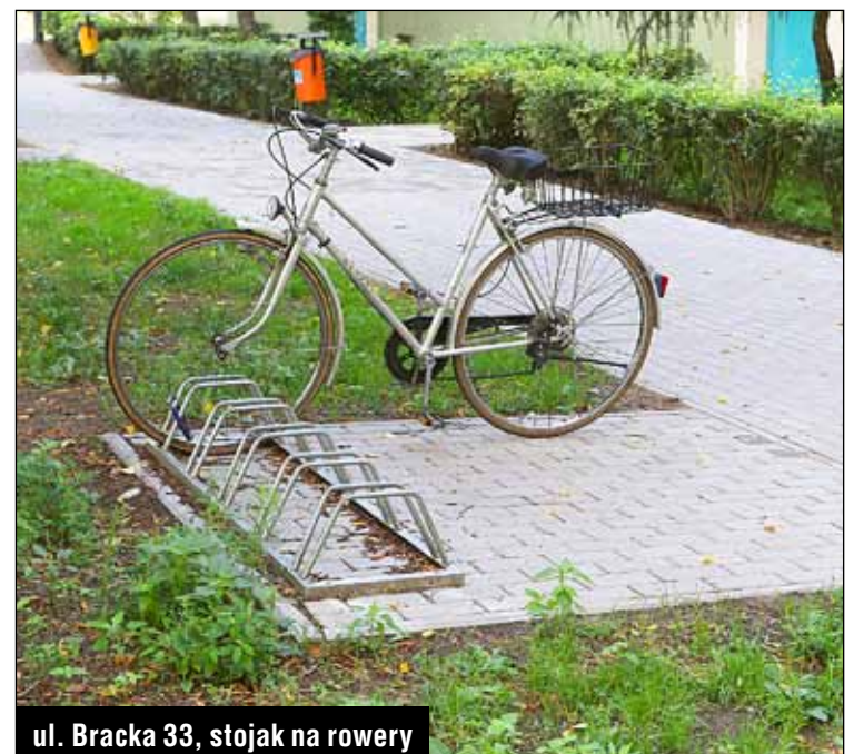
ul. Bracka 33, stojak na rowery