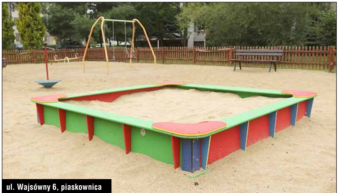
ul. Wajsówny 6, piaskownica