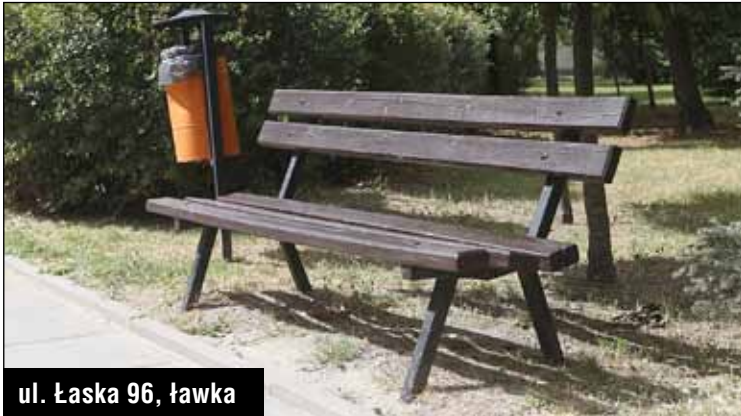
ul. Łaska 96, ławka