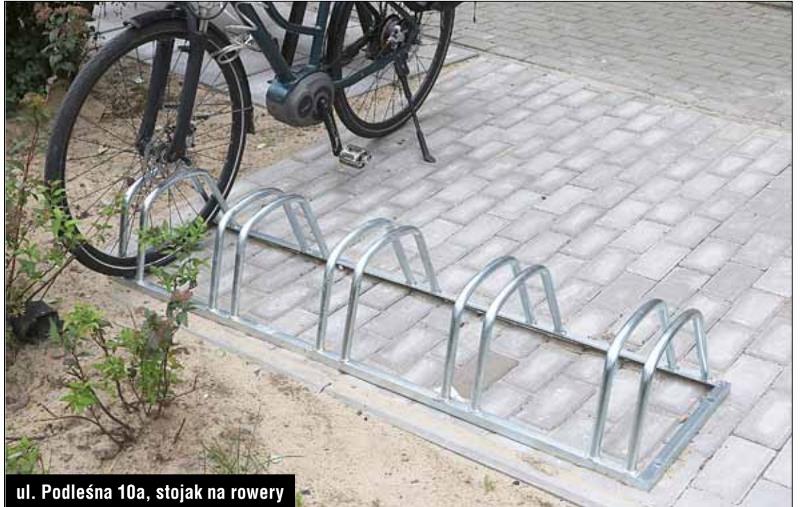
ul. Podleśna 10a, stojak na rowery