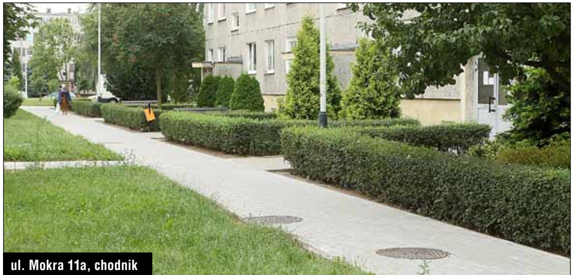
ul. Mokra 11a, chodnik