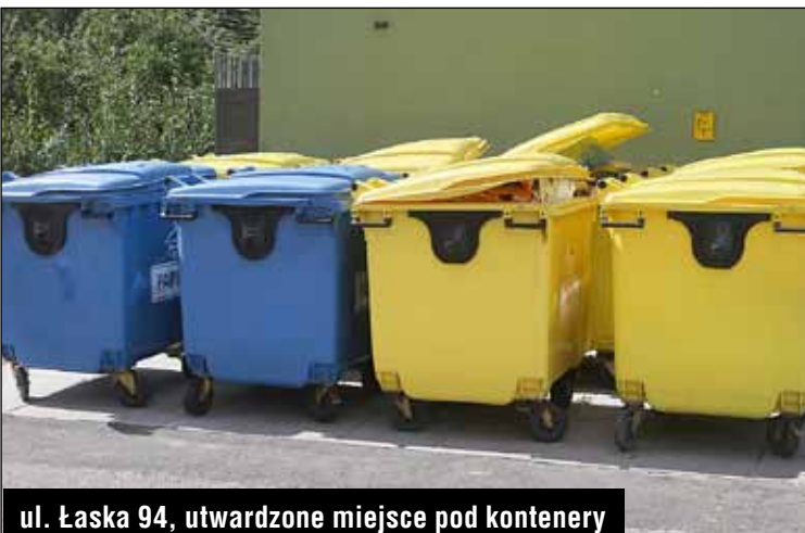
ul. Łaska 94, utwardzone miejsca pod kontenery