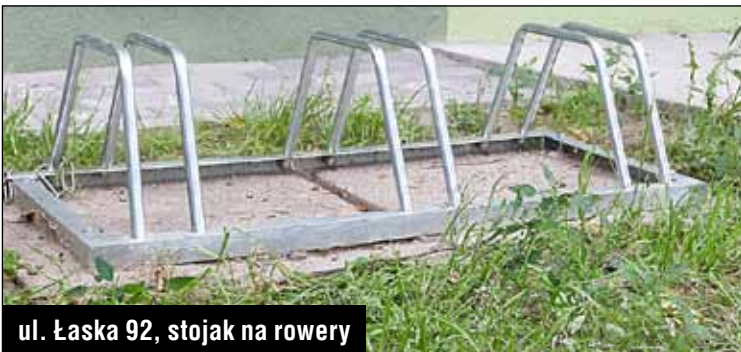
ul. Łaska 92, stojak na rowery