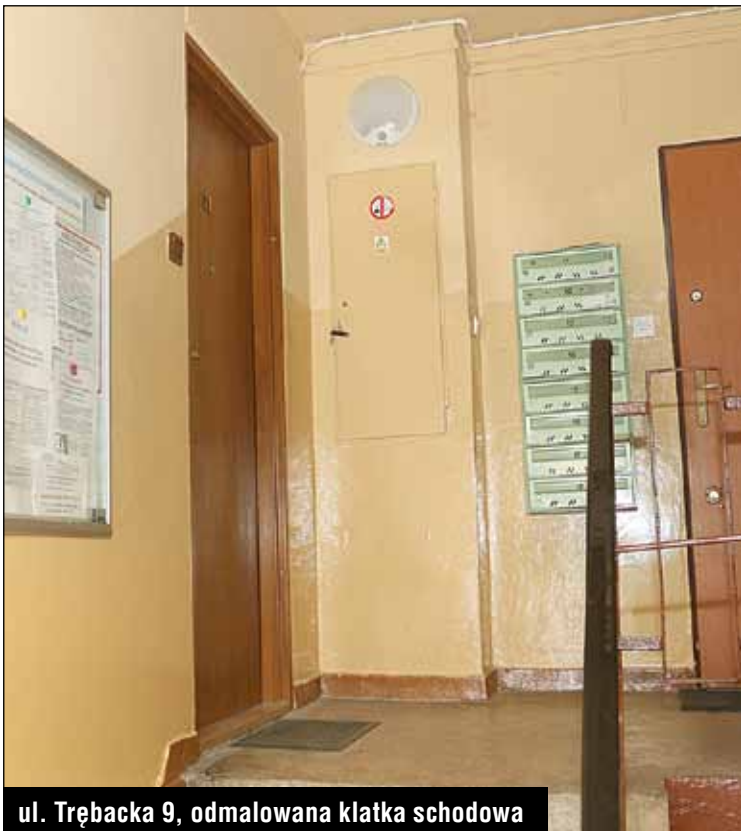
ul. Trębacka 9, odmalowana klatka schodowa