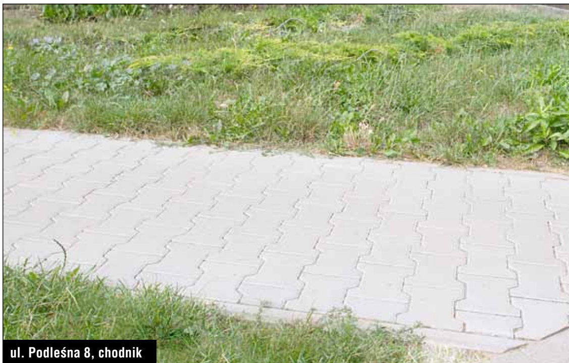
ul. Podleśna 8, chodnik