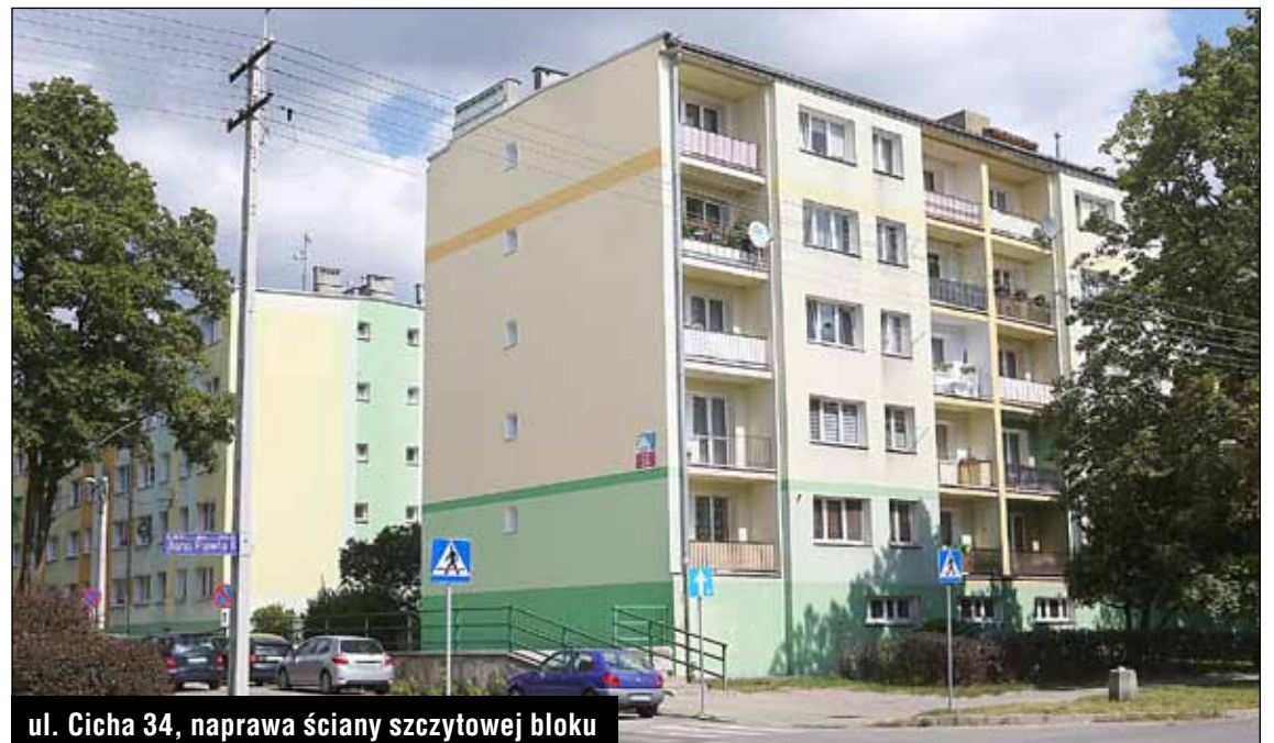
ul. Cicha 34, naprawa ściany szczytowej bloku

Częściowe wykonanie instalacji centralnej ciepłej wody odbyło się w budynkach przy ulicach: