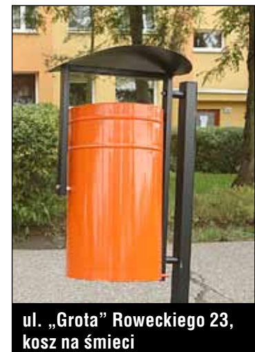
ul. „Grota” Roweckiego 23, kosz na śmieci

Dokonano kompleksowej termo- modernizacji budynku przy ulicy ▶ 20 Stycznia 64