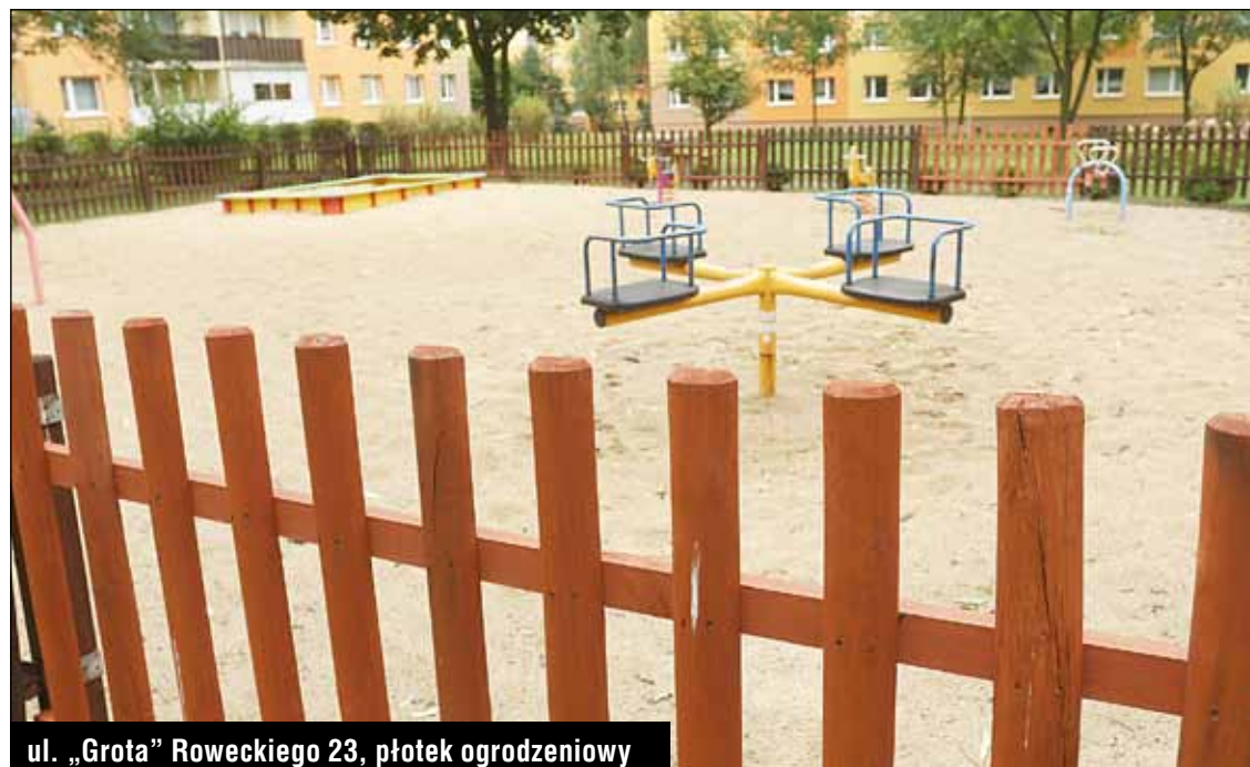
ul. „Grota” Roweckiego 23, płotek ogrodzeniowy