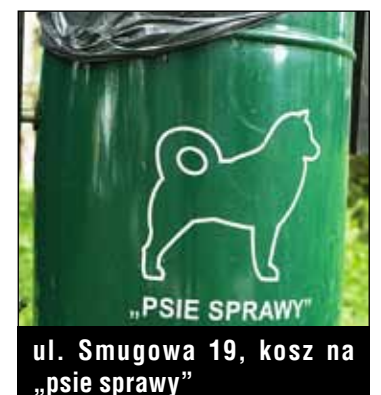
ul. Smugowa 19, kosz na „psie sprawy”