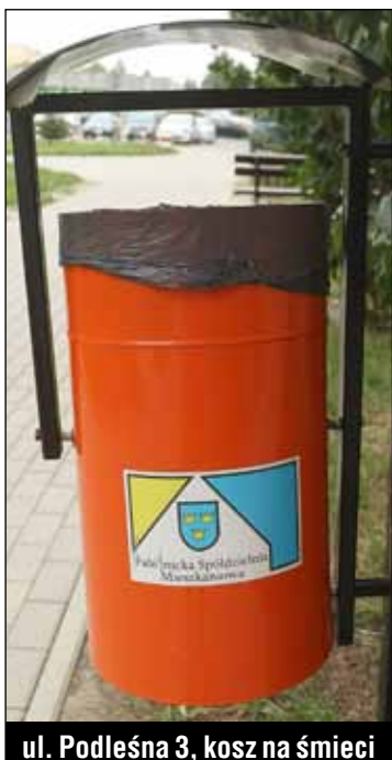
ul. Podleśna 3, kosz na śmieci

Wymieniono analogowe kasety domofonowe na cyfrowe przy wejściach do klatek schodowych w budynkach przy ulicach: