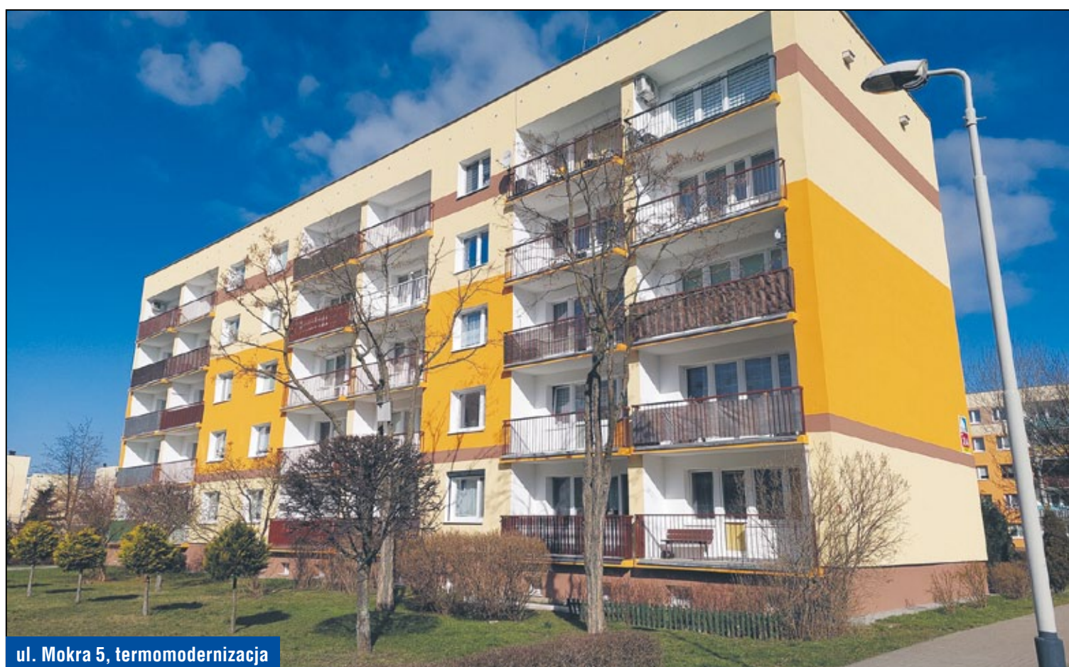
ul. Mokra 5, termomodernizacja

Wymieniono analogowe kasety domofonowe przy wejściach do