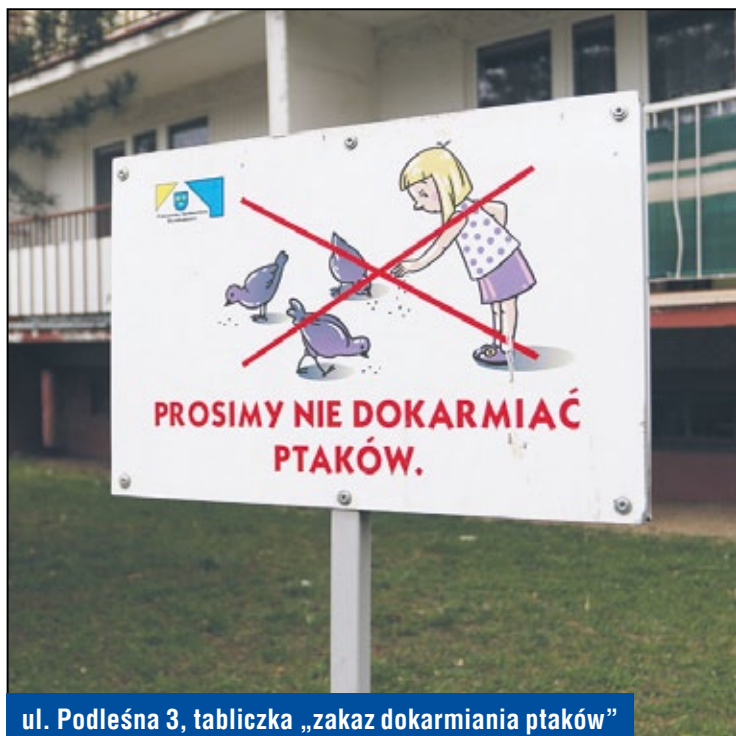
ul. Podleśna 3, tabliczka „zakaz dokarmiania ptaków”