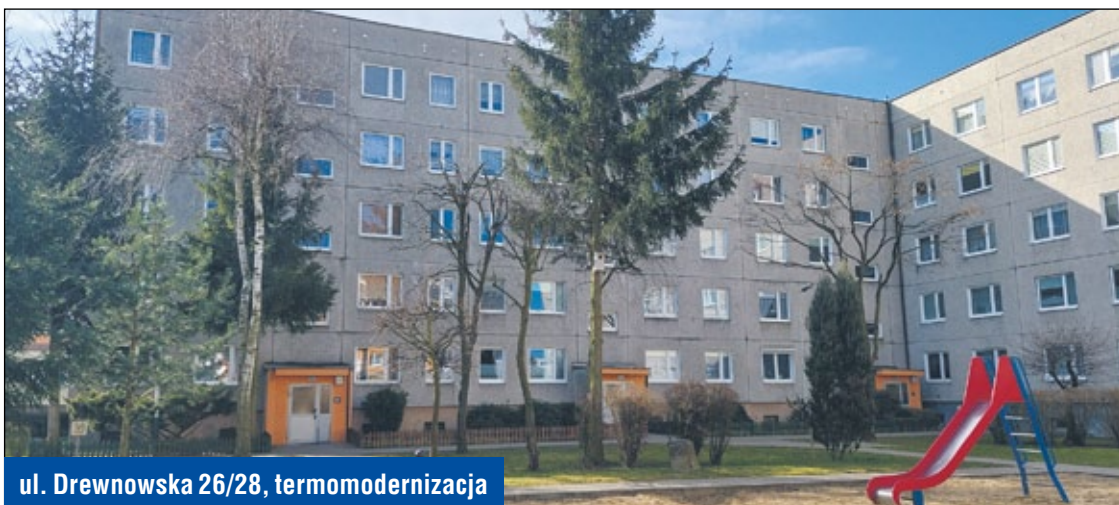
ul. Drewnowska 26/28, termomodernizacja

Dozór, konserwacja, prace inne niż konserwacyjne, okresowe pomiary kontrolne instalacji przeciwpożarowej.