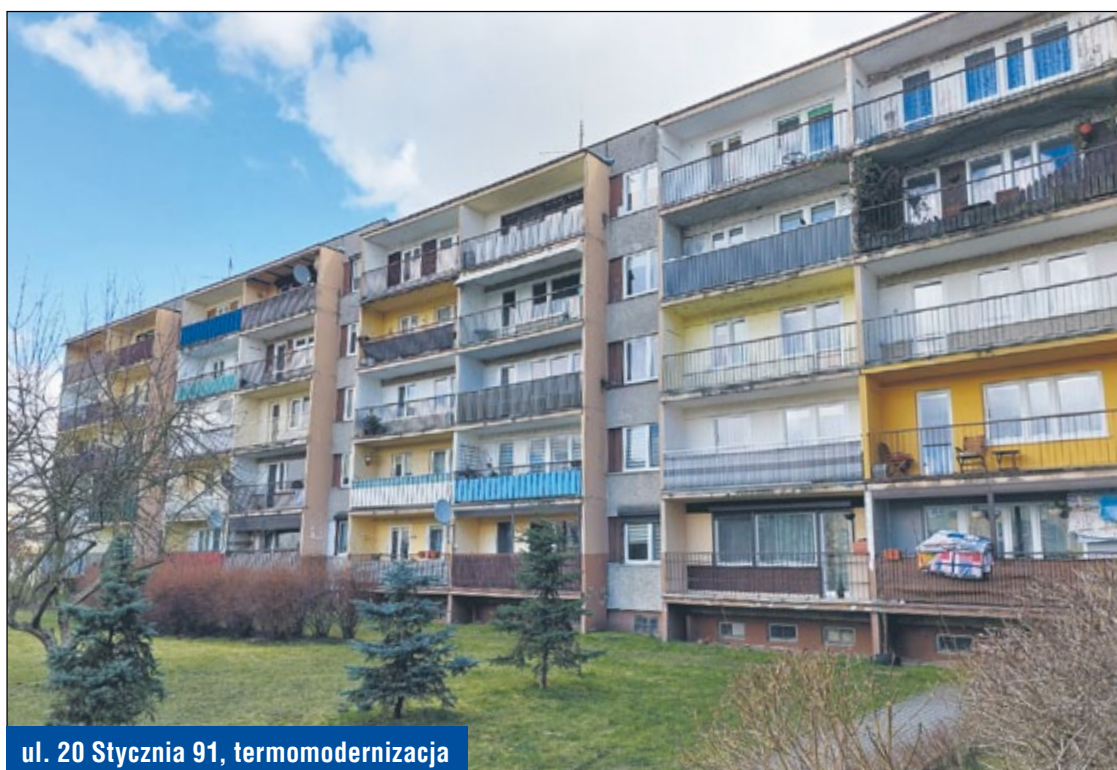
ul. 20 Stycznia 91, termomodernizacja