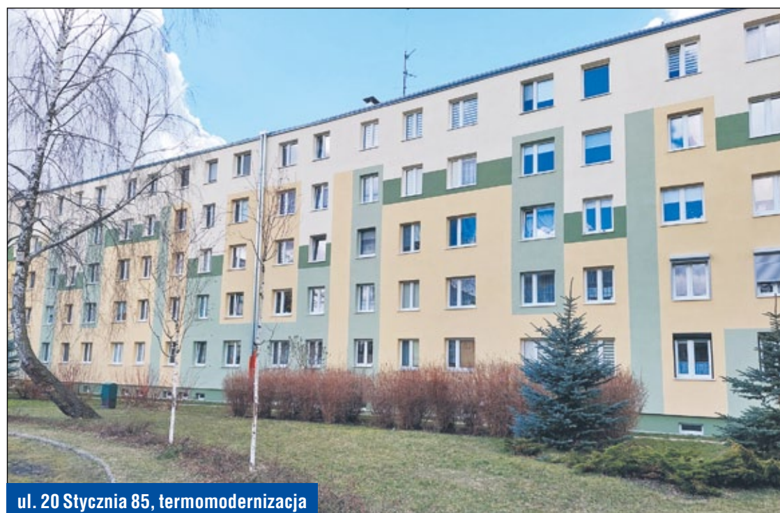
ul. 20 Stycznia 85, termomodernizacja