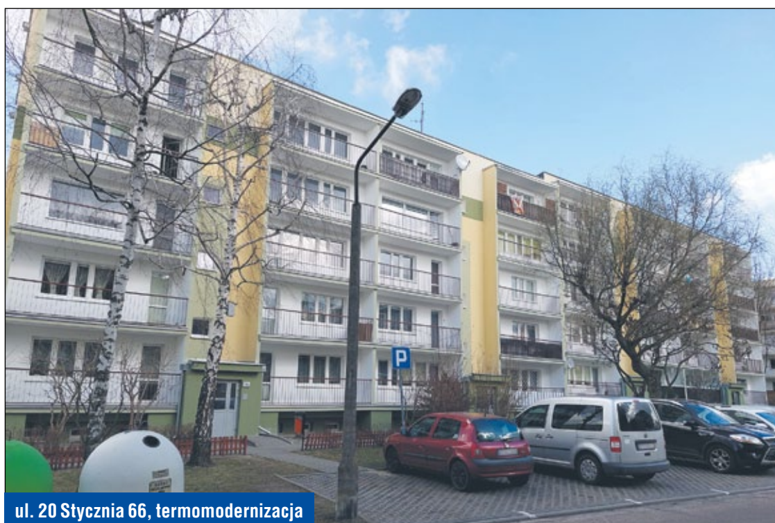
ul. 20 Stycznia 66, termomodernizacja