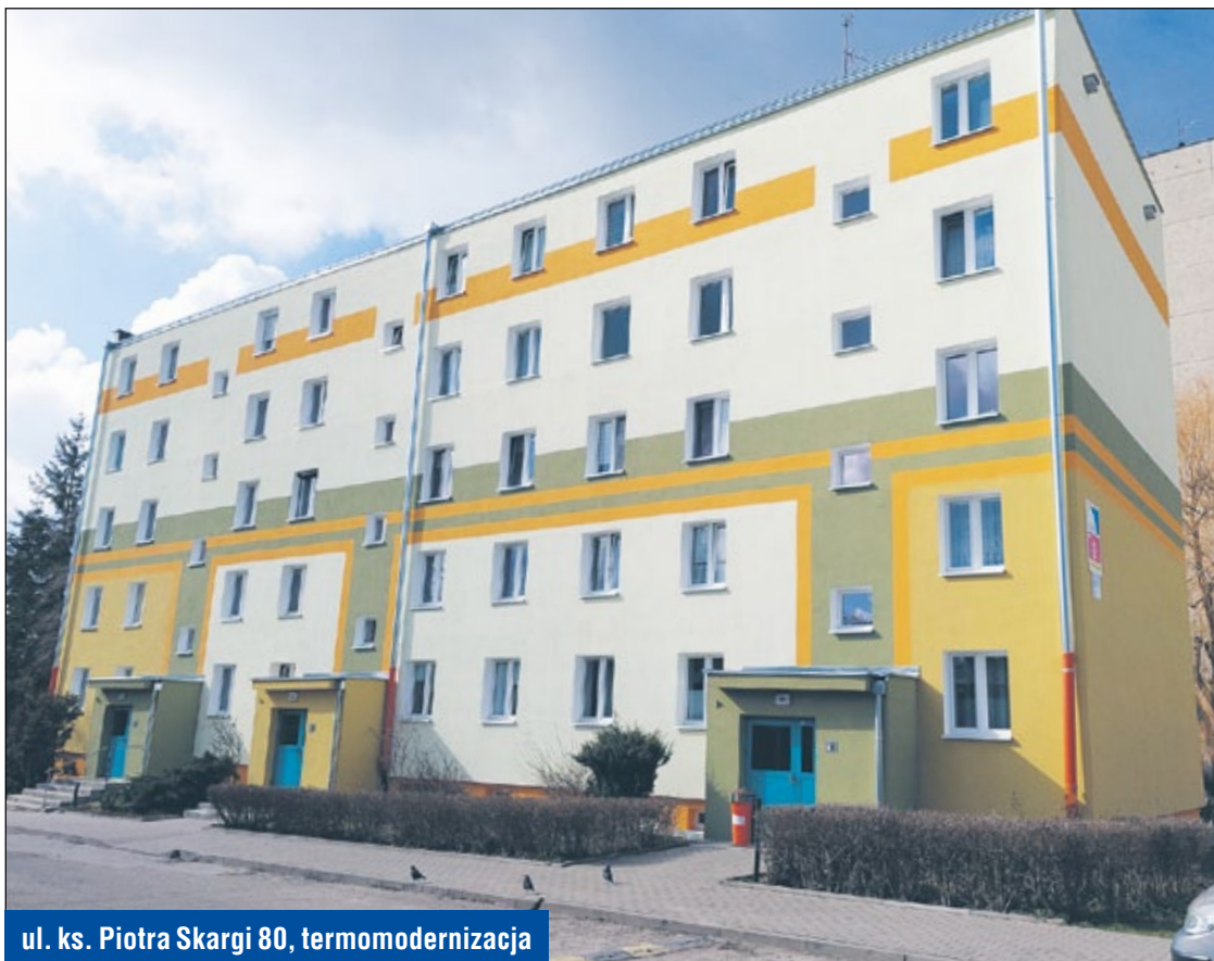
ul. ks. Piotra Skargi 80, termomodernizacja