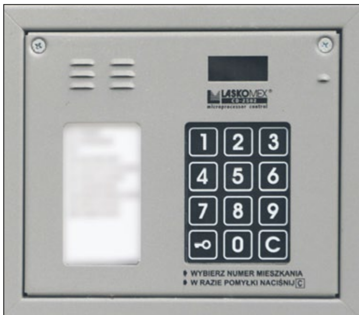
ul. Stefana kard. Wyszyńskiego 10 kl. I, II domofony cyfrowe