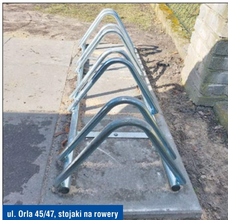
ul. Orła 45/47, stojaki na rowery