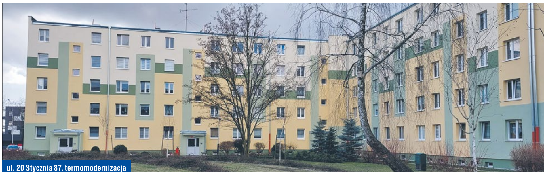
ul. 20 Stycznia 87, termomodernizacja