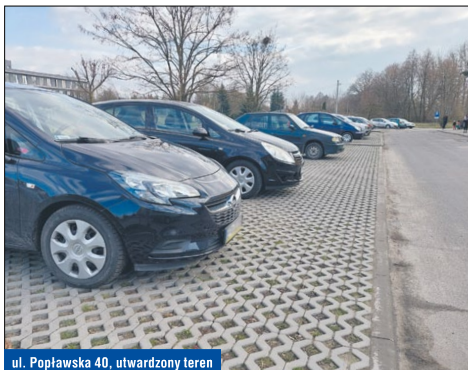
ul. Popławska 40, utwardzony teren