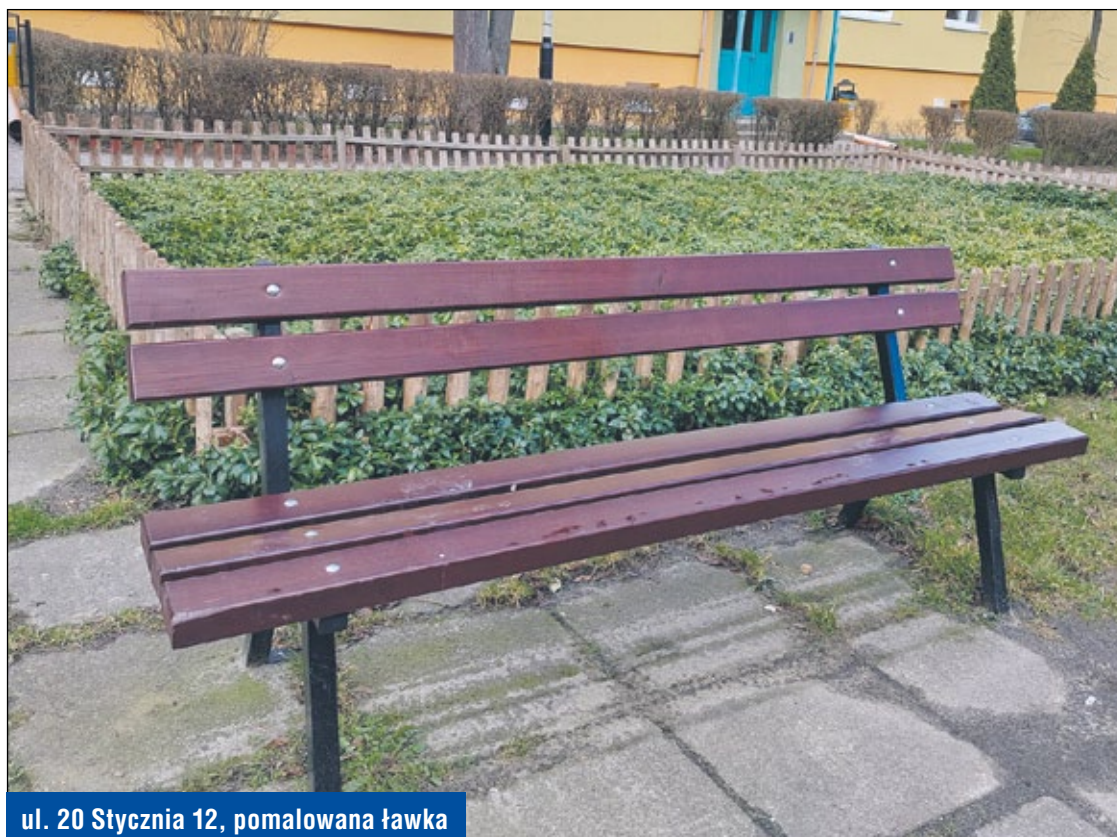
ul. 20 Stycznia 12, pomalowana ławka

Utwardzono teren pod miejsca postojowe przy ulicach: