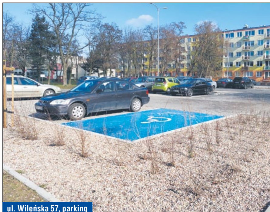
ul. Wileńska 57, parking