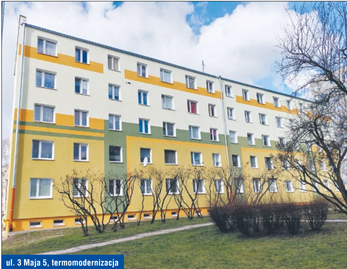
ul. 3 Maja 5, termomodernizacja