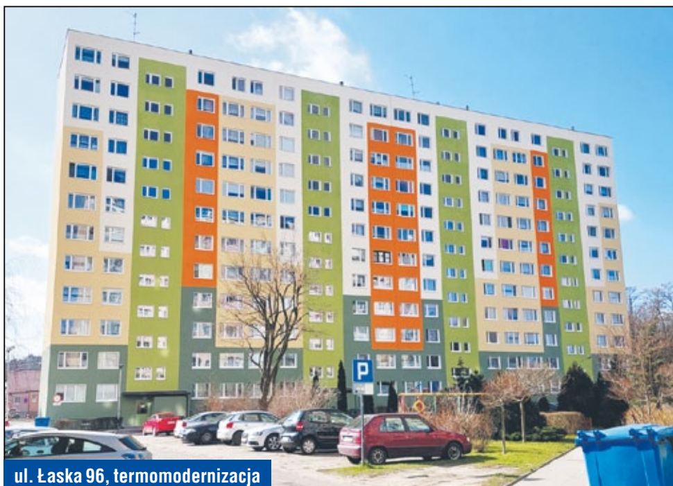
ul. Łaska 96, termomodernizacja