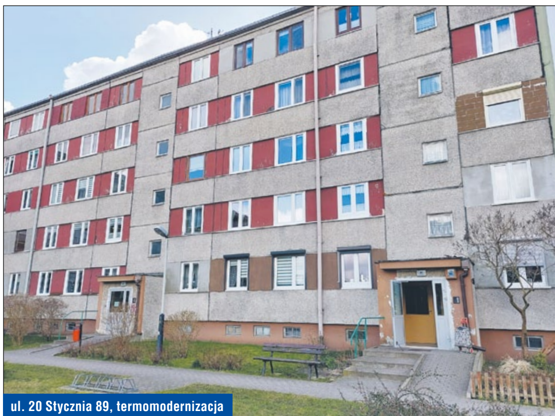
ul. 20 Stycznia 89, termomodernizacja