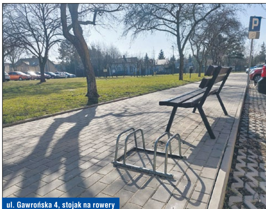
ul. Gawrońska 4, stojak na rowery