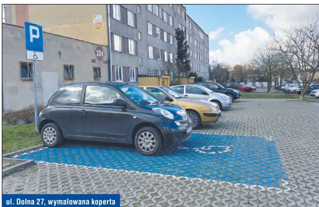
ul. Dolna 27, wymalowana koperta