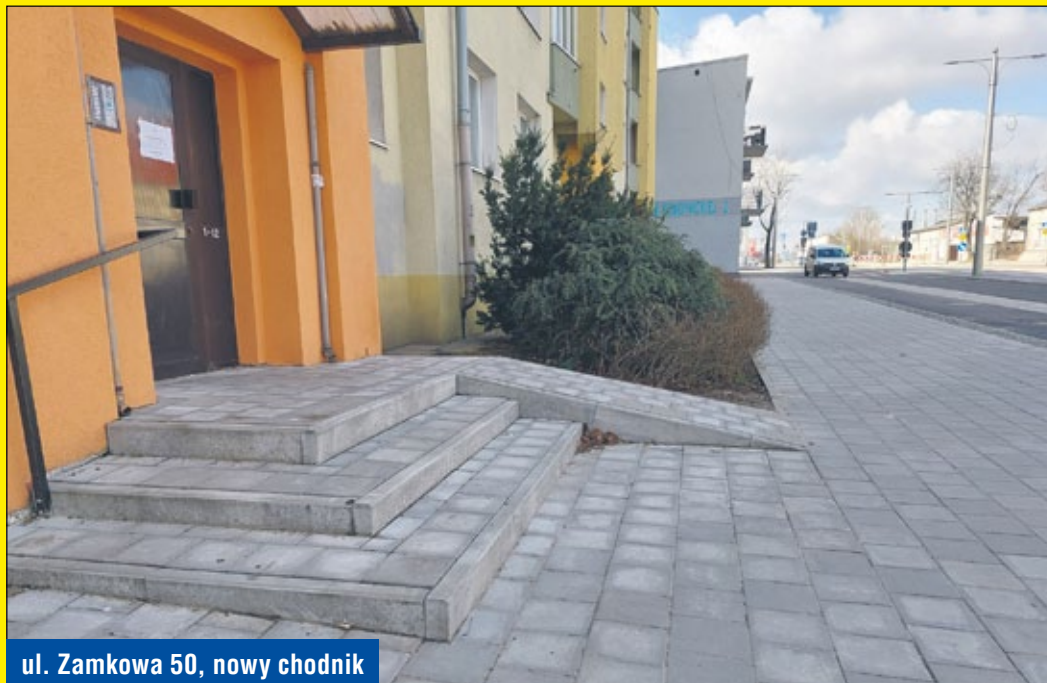
ul. Zamkowa 50, nowy chodnik