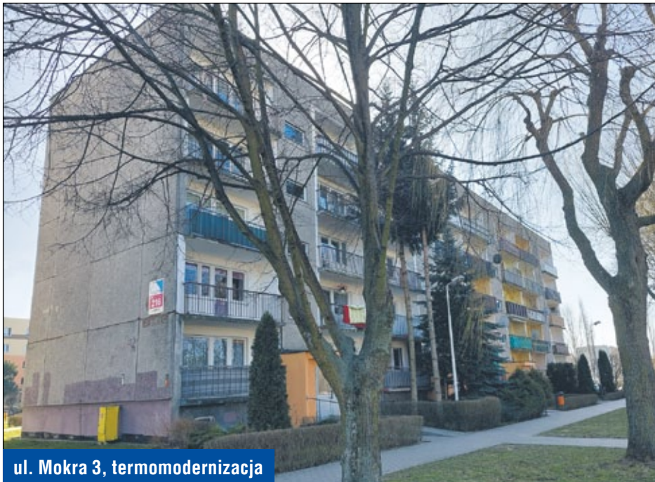
ul. Mokra 3, termomodernizacja