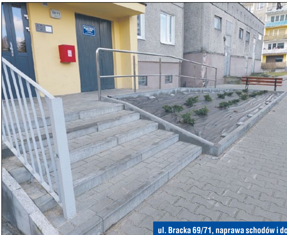
ul. Bracka 69/71, naprawa schodów i dojście do klatek schodowych, naprawa ławek