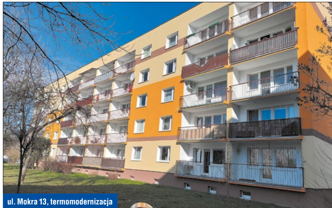
ul. Mokra 13, termomodernizacja