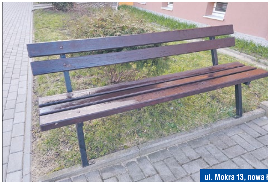
ul. Mokra 13, nowa ławka, chodnik, płotek