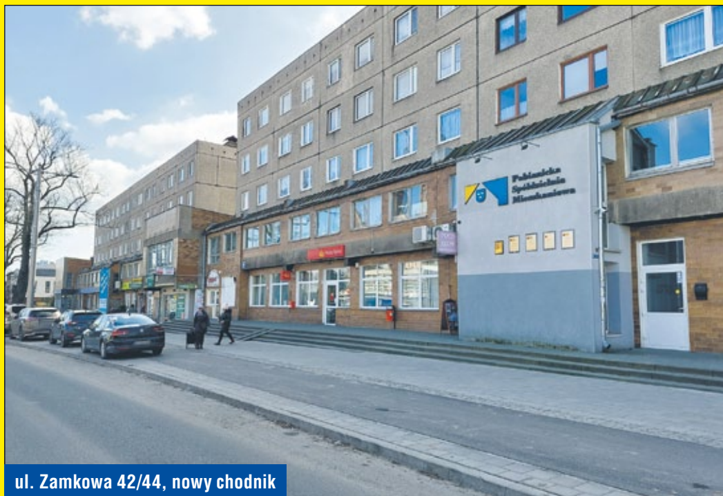
ul. Zamkowa 42/44, nowy chodnik