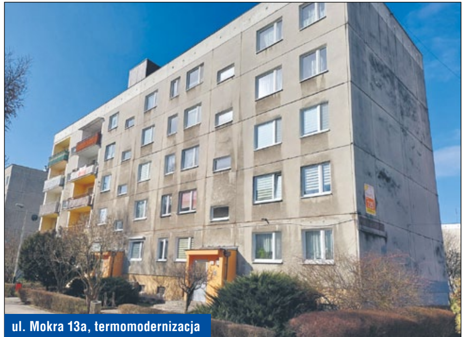
ul. Mokra 13a, termomodernizacja

Wymiana okien w lokalach mieszkalnych i w częściach wspólnych w budynkach przy ulicach: