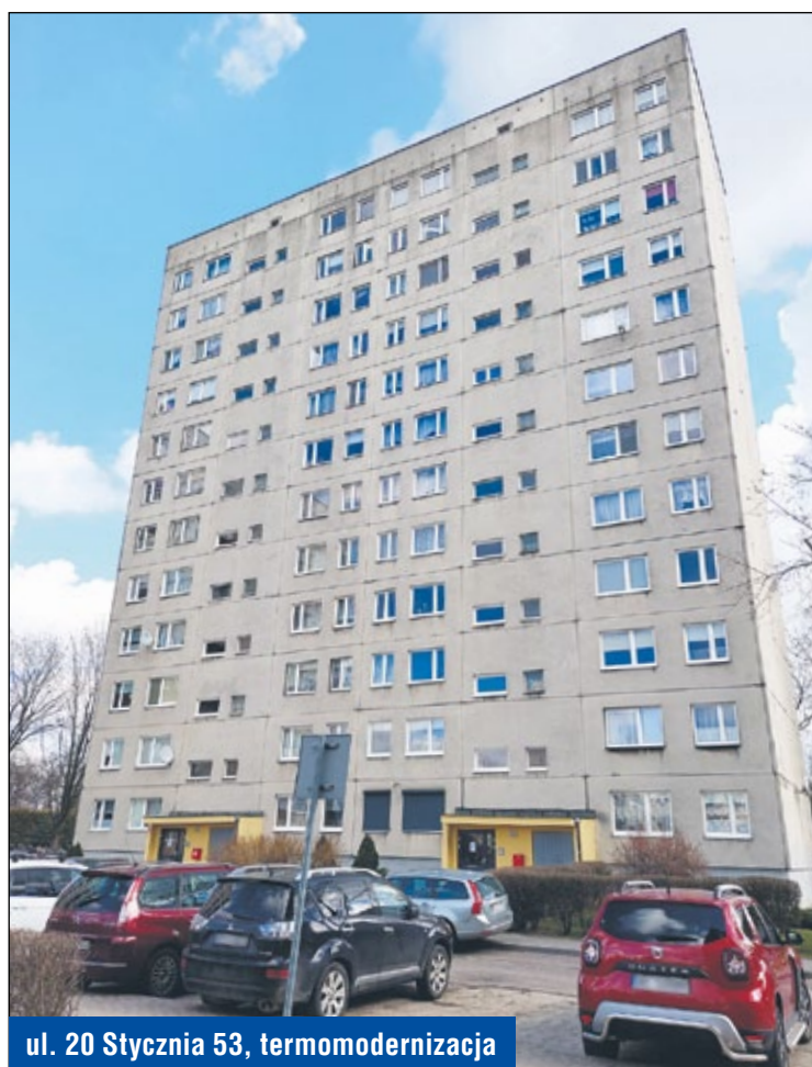
ul. 20 Stycznia 53, termomodernizacja