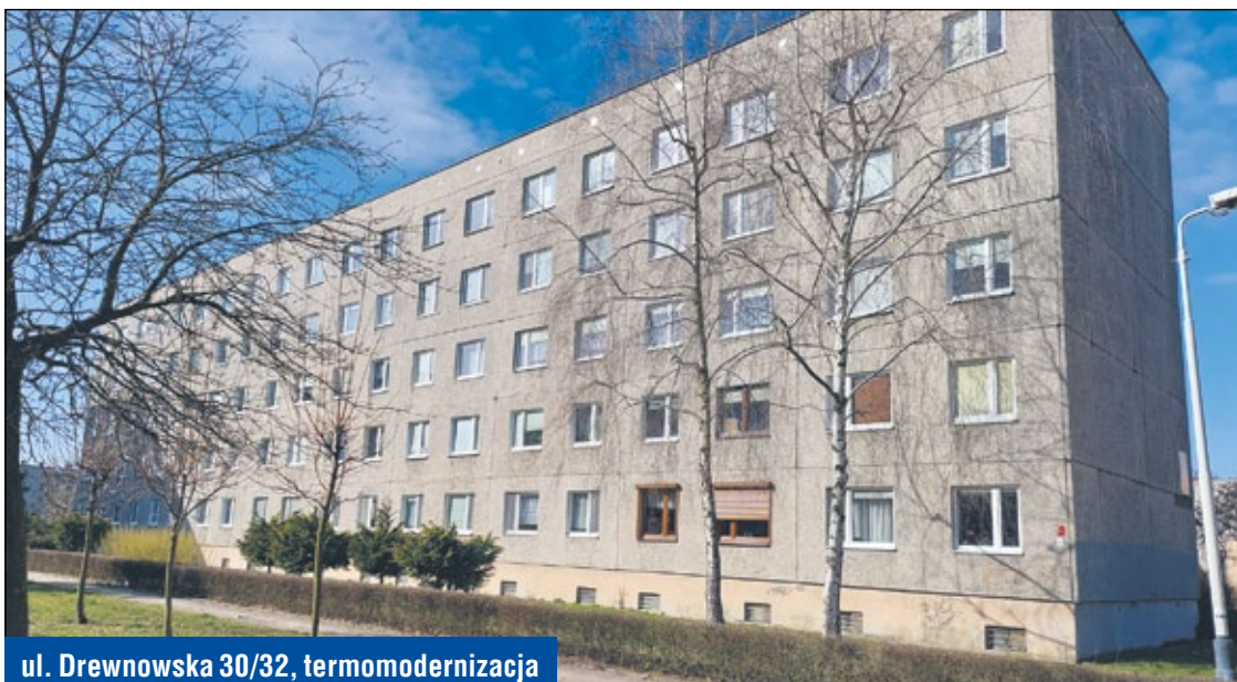
ul. Drewnowska 30/32, termomodernizacja