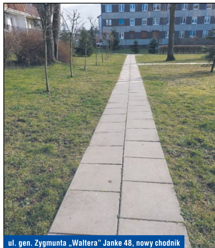
ul. gen. Zygmunta „Waltera” Janke 48, nowy chodnik